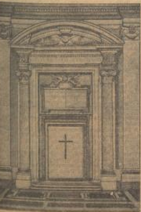
Die Heilige Pforte in romanischem Judentum. Das Tor wird laut zur in den alle 5 Jahre hundertjährigen Jubiläum geöffnet. In einer früheren Zeit wurde nur einmal, das war in den Jahren 1325-1326 durch den Papst Gregor X., das Tor geöffnet. In den Jahren 1925-1926 wurde es wieder einmal geöffnet, um die Erfüllung anzukündigen.