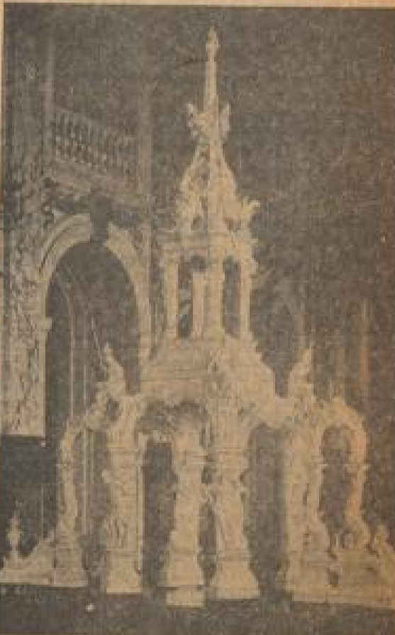
Der sogenannte „Gigantentempel“ von Johann Joachim Kaendler, das größte Porzellanstück der Welt, wurde 1785 im Auftrag des Fürsten von Sagan in Dresden angefertigt. Dieses riesige Kunstwerk hat eine Höhe von 12 Metern und eine Breite von 24 Metern.