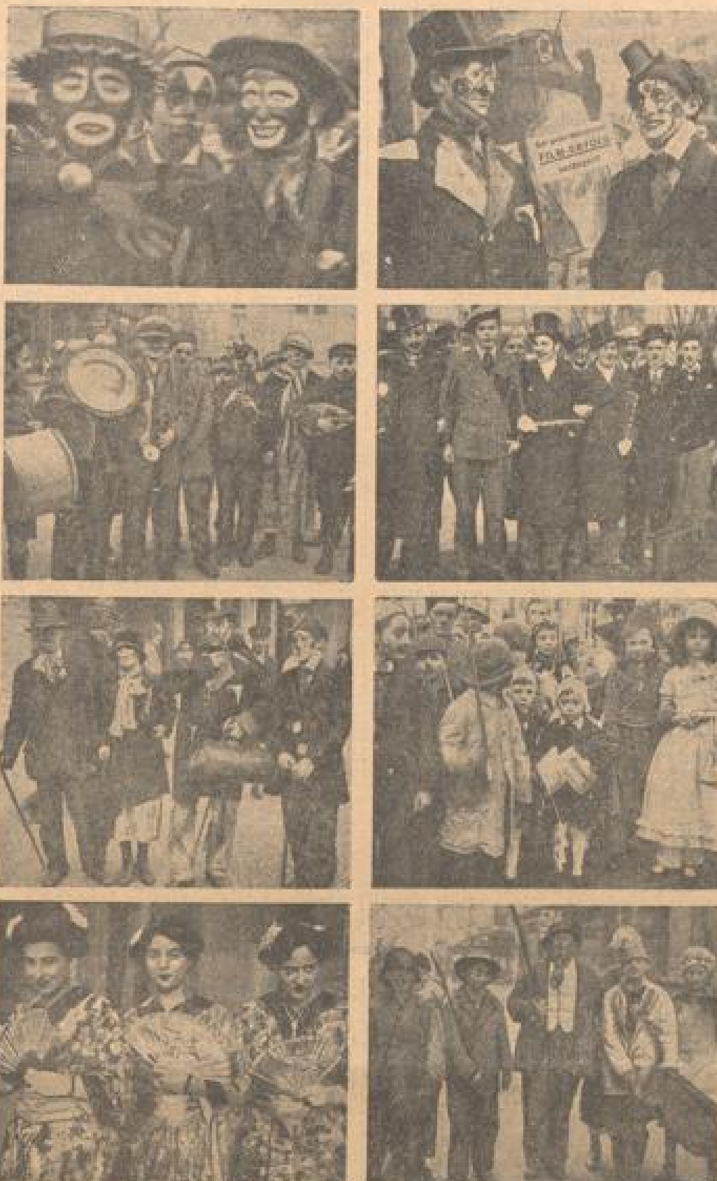
Schnappschüsse vom Faschingstreiben der Jugend in Mannheims Straßen