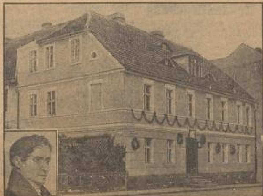
Das Wohn- und Sterbehause des Dichters Josef v. Eichendorff (Porträt unten links) in Reife