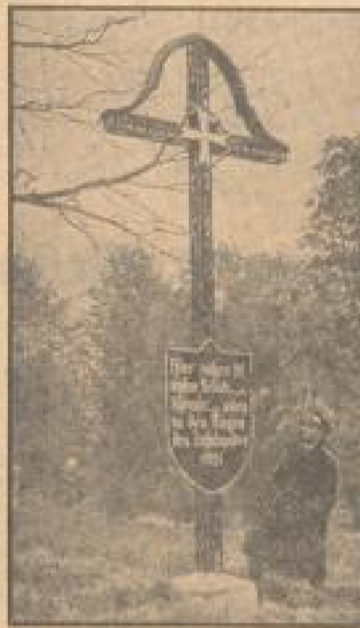
Das Gedenkmal für die deutschen Gefallenen auf dem St. Annaberg