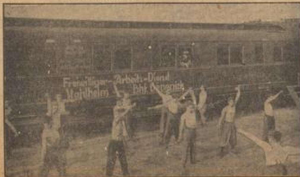
Freiwilligen der Stahlhelm-Arbeitsfreiwilligen vor dem Mannschaftswagen