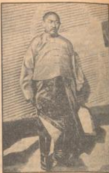
Panshan Lama in seiner Nationaltracht vor dem Fliegen

Seine Begeisterung, der Panshan Lama, das größte Überleben der tibetischen Hochalpen, der im Juni nach China fliegen mußte, unterwirft sich in einem amerikanischen Fliegen seine erste Probe. Nach für diesen Fallgefall des Herron Corps bedeuten der Flug ein unvermeidliches Ereignis.