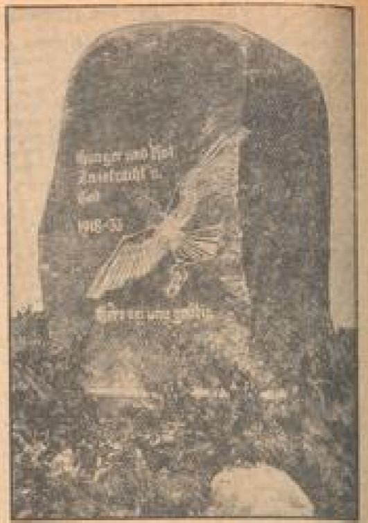
Das Glöcks-Denkmal auf dem Allen Johannisfriedhof in Freiberg (Sachsen).