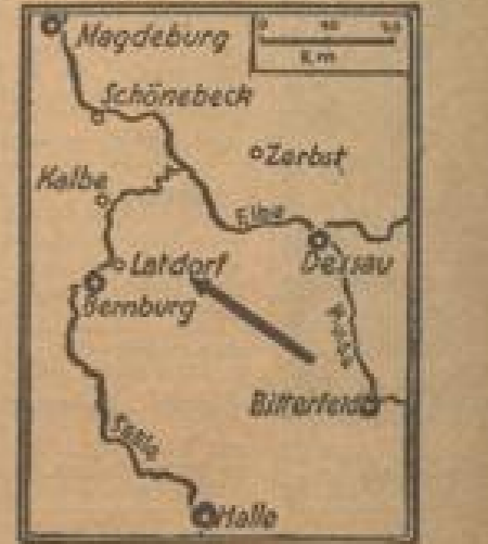
Lagekarte von Zerbst, wo ein Kalförder mit einer Wunde von 20 m in die Soale stürzte und das Herz des Fusses vollständig zertrug...