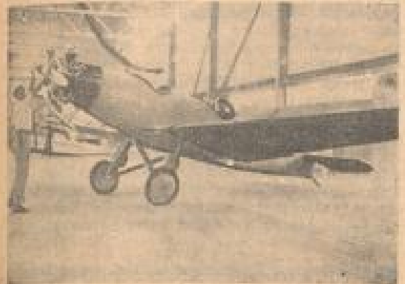
Junkers „Junior“ Schmidt-Photo Nr. 2, 23