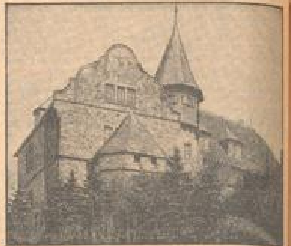
Die Burg Schwabenberg in Lippa wurde am 20. Jahre gesichert, um dort eine Kommando der SS-Abteilung einzurichten. Es werden achtzig Leute eingerichtet, an denen es etwa 80-100 Mitarbeiter teilnehmen können.

funden, um 4 Uhr 30 sind unsere Jungen über die Marne und auf der Ausgangslinie. Um... Jetzt! Jetzt ist es soweit! Feuerpause und dann ein großes Kommando an der ganzen Frontbreite. Der Orkan bricht los. X-Zeit plus 220 Sekunden. Das deutsche Kampfmeer geht vor zum letzten Sturm. Am 19. Juli 1918 war er vorbei!