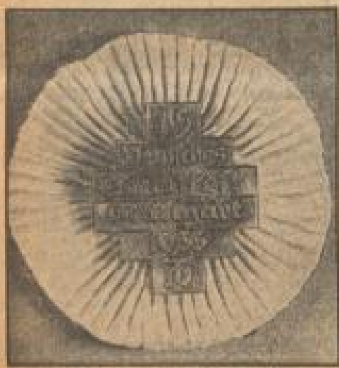
Das offizielle Abzeichen der Teilnehmer am 18. Deutschen Angriff in Stuttgart.

Der Feind kreuzt in schlauer Unruhe das ganze Gelände ab. Bei der ersten Krücke schießt er mit Phosphorgranaten. Er bringt vorübergehend Verwirrung in diesen gewaltigen Aufbruch eines Heeres, mehr aber nicht. Die Front ist nicht aufzuhalten. Langsam lauten bei den Stößen die Wehklagen ein. Um elf Uhr haben sämtliche Artillerieführer „Feuerbereitschaft“ angeordnet; gegen Mitternacht sind alle Sturmdivisionen in den Bereitstellungs-Stellungen. Nur Teile der lebenden Kräfte sind noch unterwegs. Ihre Anmarschtrassen müssen vom Gegner erkannt worden sein. Oder... Es wimmelt seit Wochen von feindlichen Spionen hinter der Front. Jedenfalls liegt