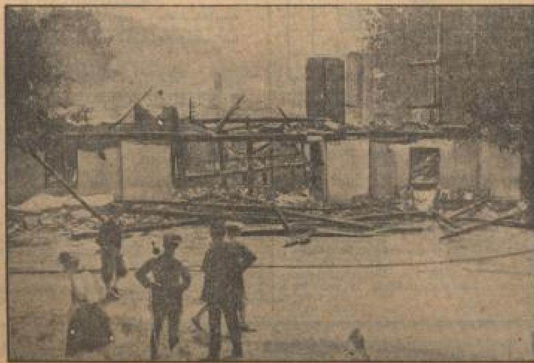
Hier stand die Strandhütte des Passionspieltheaters in Erl (Niederbayern), das durch eine Feuerbrunst völlig zerstört wurde. Das Schauspiel vom letzten Jahre hätte sich nicht Tausende von Reisenden nach Erl gelockt, das nun versteinert und leeren geblieben ist.