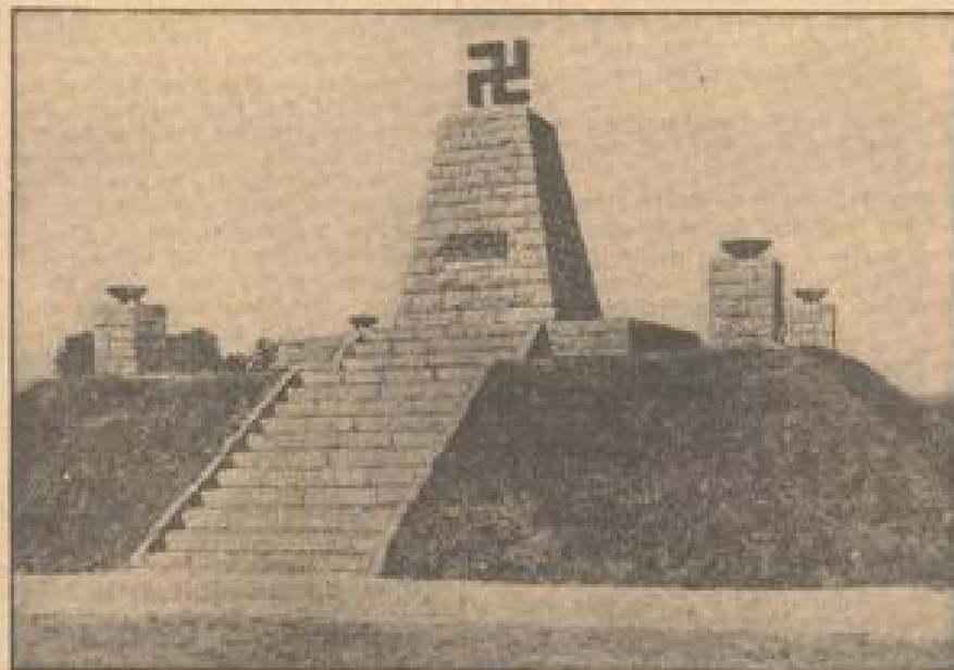
In dem mittelhessischen Dorf Hilpoltstein wurde das erste Denkmal der nationalen Erhebung, ein heiliger Obelisk, der von einem Ostentzug gestiftet ist, errichtet.

meierhoch, unübersehbar und unsichtbar das Gas ein Territorium des großen Schillers bildet, während aus den tiefsten Kellern der Feind mit unzähligen schweren MG's das Niemandsland absperrt, schleichen sich deutsche Pioniere vor. Die Nähe haben sie mit Gras und Sandflächen umwickelt. Sie tragen keine Waffe, um auch den geringsten Laut zu vermeiden. Sie schleppen Pontons, Unausführlich, einen nach dem anderen. Auf der Mittelstraße, vierhundert Meter vor der Marne, werden sie niedergelegt. Wegen fünf Uhr wird es eine kurze schlauerartige Feuerpause geben. In der Zeit müssen sie mit dem den Pontons unentdeckt an das Ufer kommen.