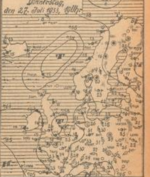
Wetterkarte vom 27. Juli 1933, 11 Uhr. Die Karte zeigt die Temperaturverteilung in Europa und den Mittelmeerraum...