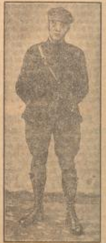
Ein Anhänger der wachsenden Bewegung in der angrenzenden Provinz. Nach in Belgien ist jetzt ein nationalsozialistischer Bewegung ins Leben gerufen worden, die in ihr Programm zahlreiche Merkmale des deutschen Nationalsozialismus übernommen hat.