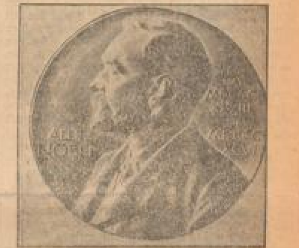
In Schweden wurde zum 100. Geburtstag Nobels ...