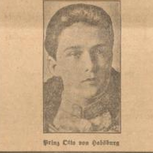
Prinz Otto von Habsburg

Auch die böhmerischen Ausbürgerungen wegen unerlaubter Rückkehr nach Deutschland gehen weiter. In Wien in Niederösterreich wurde 25 Personen die