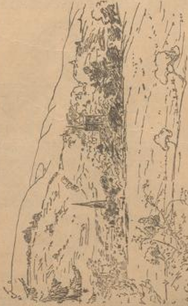
Neustadt an der Saardt