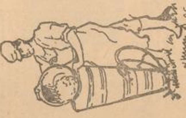
Der Pfälzer Bauer