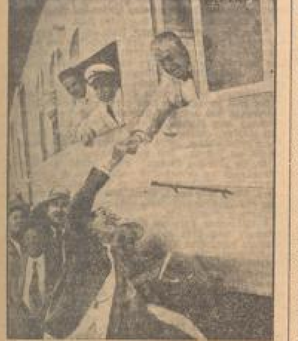
Nach der Fahrt zur Ostküste Mexikos überquerte der deutsche Luftkrieger „Graf Zeppelin“ den Atlantik des Ozeanischen Ozeans, wobei er auch in den kanarischen Inseln über Miami, an der Küste von Florida, landete. Der Präsidentschaft des United States Air Corps begründet er, Opa Zeppelin und jetzt der Weltluft wüttemen.