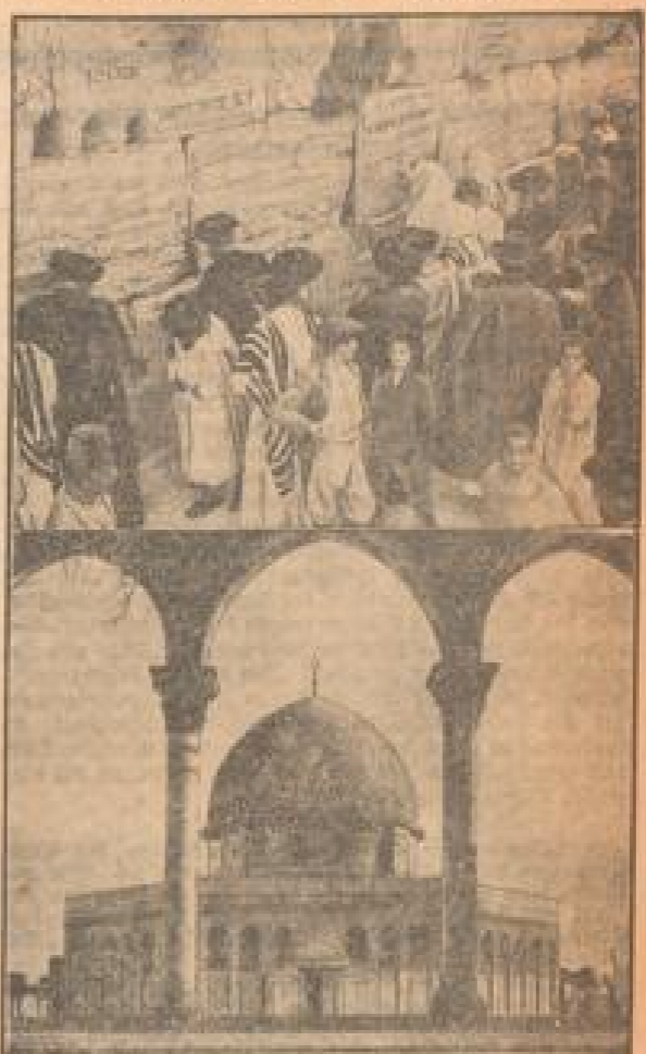
In Palästina kam es kürzlich noch intensiveren Zusammenstößen der Araber zu israelischen Zusammenstößen mit der englischen Polizei, bei denen viele Personen getötet und verletzt wurden. Die Polizei verfügte über mehrere Plätze des Araber-Aufstands. Unter Bild zeigt zwei Kämpfer der israelischen Polizei. Oben: Die Zusammenstöße der Juden in Jerusalem. Unten: Die Zusammenstöße in Jerusalem, ein Zusammenstoß der israelischen Araber.

gewaltigen britischen Kolonialreich geübt. Er war früher Maringellicher und pflegt auch heute noch sehr gern sein Seemannsgut an zu zeigen, wenn er Karrofen trifft. Besonders bekannt wurde er durch seinen für einen weltlichen freilich etwas ungewöhnlichen Picknickspott — er ist leidenschaftlicher Boxer und als solcher ein nicht zu verachtender Gegner. Nicht zuletzt diesem Sport hat er es zu verdanken, wenn er überall das größte Ansehen genoss.