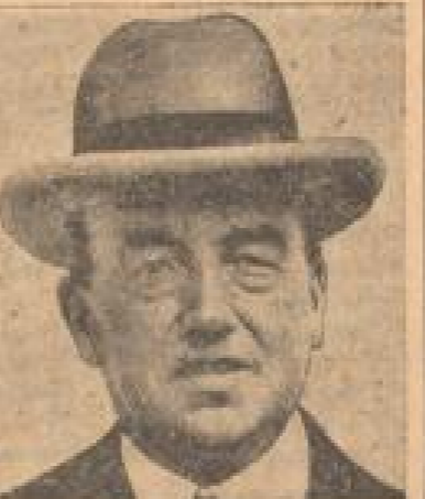
Franz Heckerling, der Präsident der Reichstags- sammlung.