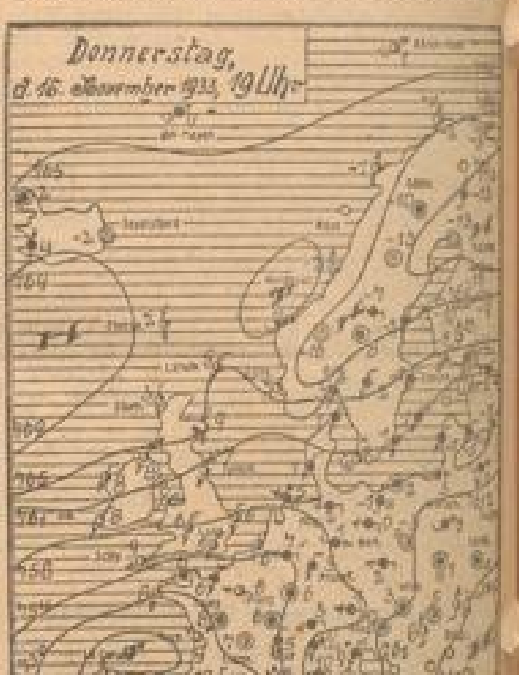
Wetterkarte der Frankfurter Univers. Wetteramt