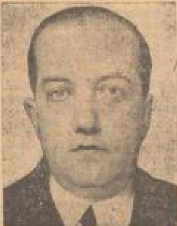
Josef Hoff, der neue politische Gesandte in Berlin.