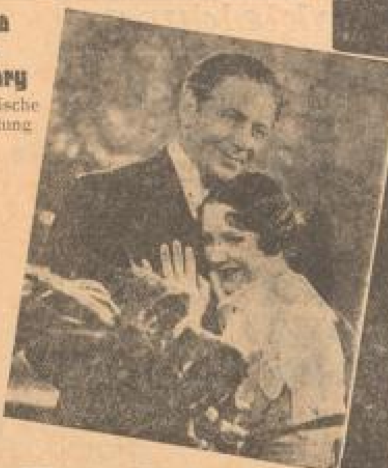
Geza von Bolvary Künstlerische Oberleitung