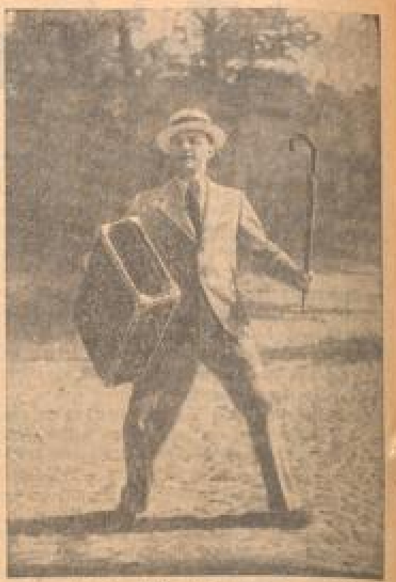
Dem Welt mit rechtliche Mann empfielt...