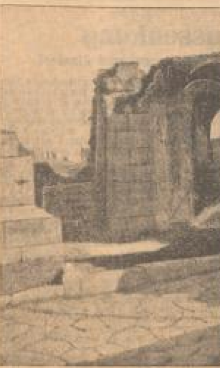
Eine frisch freigelegte Straße, die die Panzerstraße.

Auf der Zeichnung ist von Pompeji, der durch den Ausbruch des Vesuvius im Jahre 79 n. Chr. völlig zerstört wurde, die Ausgrabungen der letzten Jahre zu sehen. Immer wieder ergeben die Ausgrabungen überraschende Bilder von dem Leben der alt-römischen Kultur und Zivilisation.