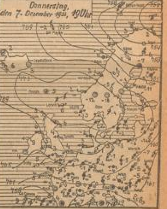
Wetterkarte der Frankfurter Unioerl-Wetterwerte

Verlaß der Deutschen Wetterdienststelle Frankfurt a. M. vom 8. Dezember; nach einer vorübergehenden Wäandlung ist bereits schon wieder ein neuer Kaltluftdruck aus Nordosten eingekehrt. Er wird auch in Süddeutschland, wo heute früh noch vielfach wolkiges Wetter herrscht, Aufhellung und neue Frostverläufung bringen.