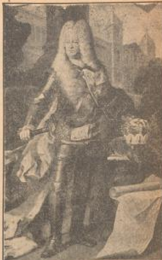
Kurfürst Carl Philipp mit Hauptplan der Jesuitenkirche