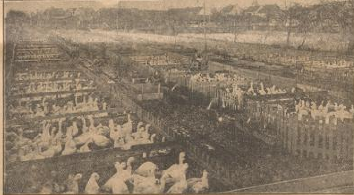
Ein Heer von Silvestergänsen erwartet sein Schicksal

Zwischenberg liegt längst hinter uns. Noch immer fahren wir auf der schwarzen Straße durch den Wald. Dann aber weicht sich das Panzerband, die