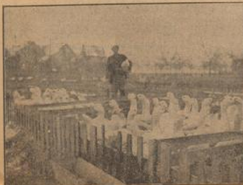
Blick in einen Gänsestall

Wir fahren durch eine Straße, in der der Schnee lachend liegt und hollen vor einem Haus, dessen Tor mit vielen Geflügelkörben verpackt ist. Hier ist der größte Geflügelhändler und Gänsewäher an Ort und Stelle. Er heißt er, ein geschäftiger Mann, in dessen Büro der Herrspracher ununterbrochen klingelt. Mit einer Handbewegung zum Fenster hin, deutet er auf die Größe seines Unternehmens. Er ist wohl einer der leistungsfähigsten Geflügelhändler in ganz Süddeutschland. Im Jahr wer-