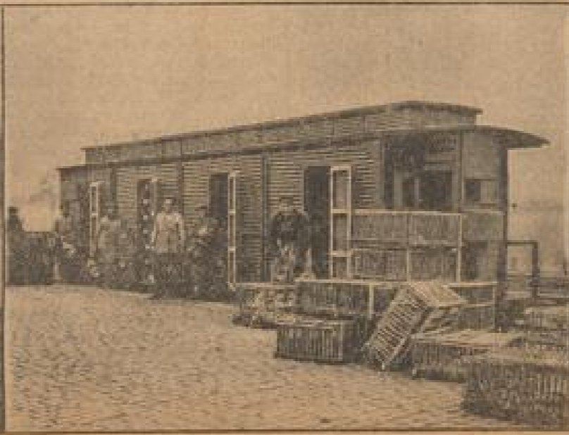
Ein Geflügeltransportwagen ist angekommen