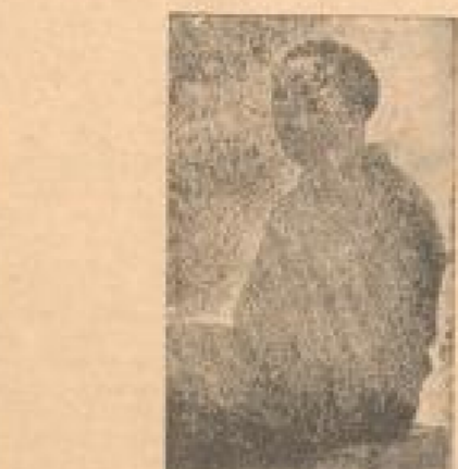
Schwimmer, Göttingen, Weltmeisterschaft im Schwimmverein

Ueberraschend war der Sieg im Völkerkampf gegen Ungarn am 12.-13. August in Budapest. Die deutsche Mannschaft siegte über 2:1.