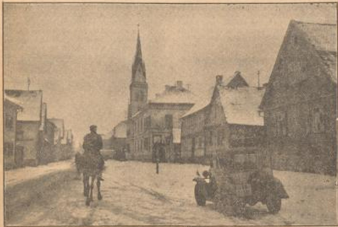
Schnee bedeckt Dächer und Straßen von Großzimmern

Aber so, wie die Dinge heute hoch liegen, kommt die Gans nicht so in Reife verpackt an und Bauer und Industrielle, die von der lebendigen Bereicherung des Geflügels einen Nutzen haben könnten, werden überhaupt nicht beangereizt. Während die Tiere lebendig eingeführt, in wässrigen Futtermittel verpackt, Korbe, Zelle, Barren zur Verpackung benötigt, kurz es würden nicht lebende Gänze in Takt geflügelt gehen. Leider ist Deutschland heute so, wie mir erklärt wird, auf eine Geflügelindustrie angewiesen. Das Schlacht des Geflügels, das in unseren Gassen anliegt, gelangt als Fertigmast ins Land, Ostland, Ungarn, Polen und Südrussland sind die häufigsten Lieferanten. Hier müßte verlegt werden, den Import einzubämmern.