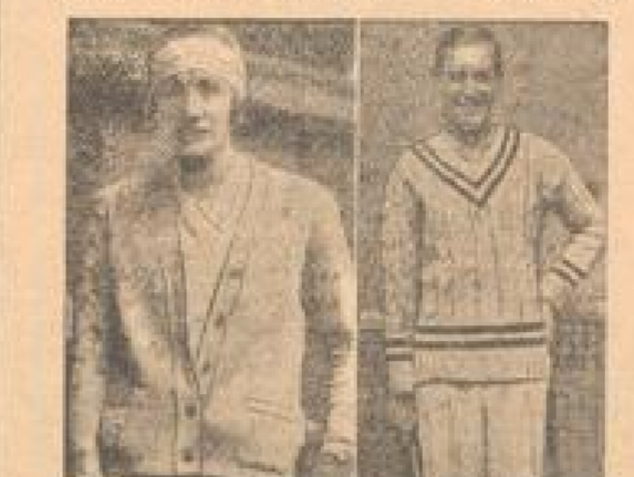
Fel. Krahwinkel und v. Cramm, Tennisspieler im Tennisclub