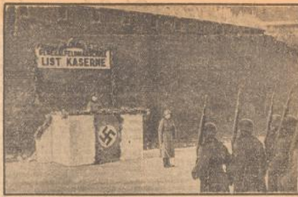
Eröffnung für Generalfeldmarschall List in Krakau