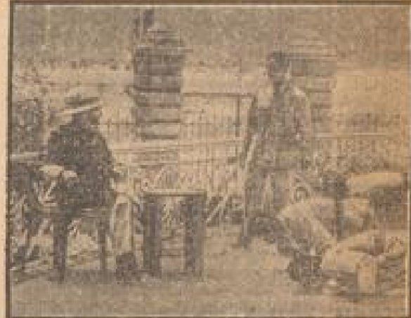
Der „König der Könige“ empfängt