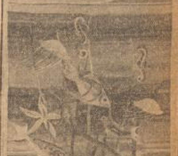
Wallerbeispiel der Bildweberei am Stadtwall: Der „Bildweberei“ (Garnitur, Ulrike Burdorf, Bildweberei, Bildweberei, Bildweberei)

Steinerne Zeugen deutscher Kultur Das Reichland in Flora