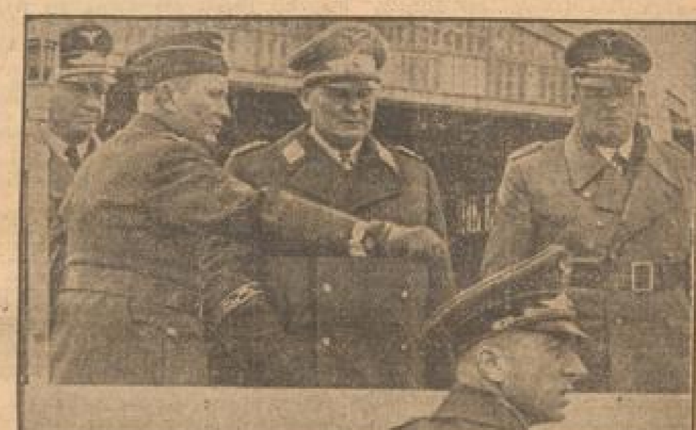
Der Reichsmarschall auf einem Gefechtsstand an der Kanalküste

Es ist nicht nur das Wehl, sondern die Pflicht des deutschen Kommandanten, gegen derartige bewaffnete feindliche Dampfergeschiffe vorzugehen, wie er es getan hat, nämlich durch Angriff zunächst die Kampfkraft des feindlichen Schiffes auszuhebeln, damit diese seinem eigenen Schiffen nicht mehr gefährlich werden kann. Nachdem dies gelungen war, ist alles zur Rettung von Passagieren und Mannschaften erfolgt, was möglich war. Die verantwortungsvolle diese Rettungsaktion durchgeführt wurde, geht aus dem hohen Zahl von rund 500 Männern, Frauen und Kindern hervor, die das deutsche Kriegsschiff auf der Südseeinsel in Sicherheit gebracht hat. Wenn die australischen Angaben zutreffen, daß auf der „Manila“ neben Frauen und Kindern gefangen sind, so würden sie in der Tat die unglücklichsten Opfer der britischen Kriegsführung geworden sein. Die Frauen und Kinder den unmittelbaren Kriegsgefahren an Bord bewaffneter Schiffe ausgesetzt. Auf die Weibchen, denen die Passagiere auf bewaffneten feindlichen Schiffen ausgesetzt sind, ist von deutscher Seite immer wieder hingewiesen worden.