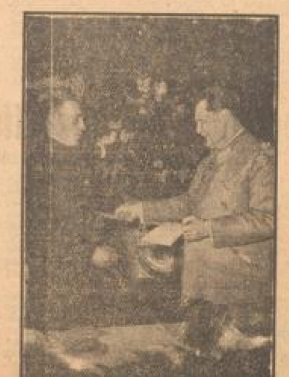
Göring deutscher Bergleute durch Reichsmarschall Göring