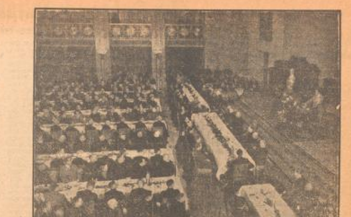
Reichsmarschall Göring bei den Bergarbeitern

„Wo ist der Herrscher des Schlosses leidet?“