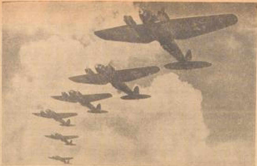
Zum Tag der Luftmasse am 1. März Zwei Reihen He III, die sich zum Ausritt formieren. (F.R. Grosse-Blitz, Sonder-Kultur-2.)