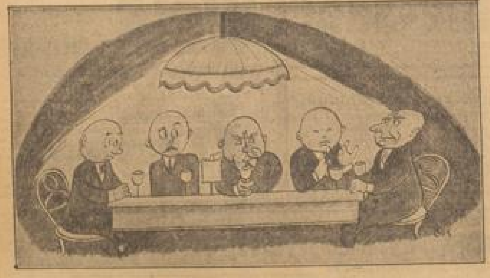
Nicht wertlos zu nehmen. — und jetzt wird ich Ihnen eine besonders beachtenswerte Geschichte erzählen.

Der Sohn meldet sich zur Stelle. Der Zeant des Berneffens.