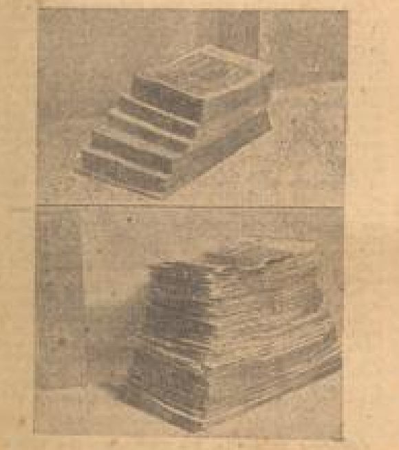
Der Selbststein verliert seine 'Zorgensalten'