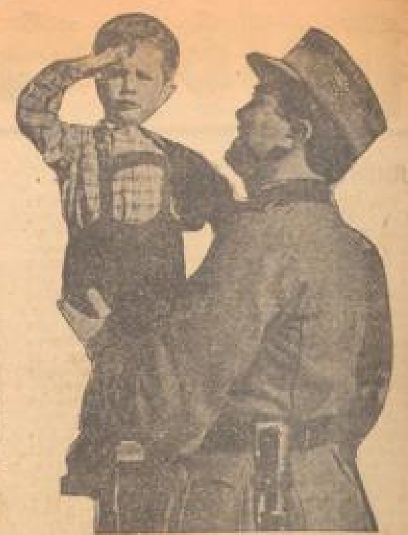
Der Sohn meldet sich zur Stelle. Der Zeant des Berneffens.

Der Sohn meldet sich zur Stelle. Der Zeant des Berneffens. Die vier Gefellen. Die vier Gefellen sind vier Götter, die in der Mythologie eine wichtige Rolle spielen. Die vier Gefellen sind vier Götter, die in der Mythologie eine wichtige Rolle spielen.