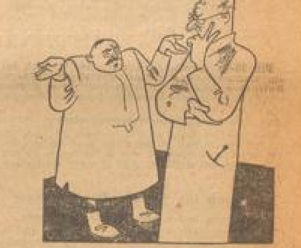
Seine Redeweise... 'Für Gatten nehmt mir gar nicht...'