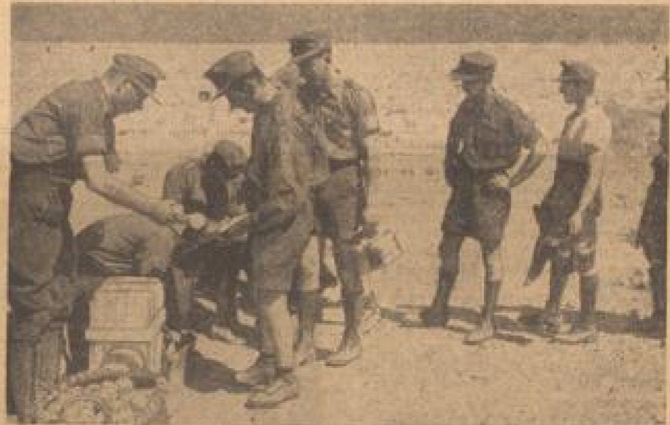
„Offenbar“ in der Nähe... Deutsche Truppen bei der Besetzung...