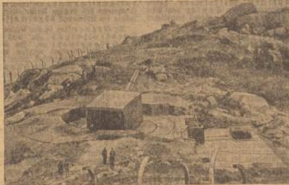
England aus dem Bernen Osten in die Verteidigung gedrängt

Während bisher nur einzelne Truppenstücke Konzentrationen und Aufstellungen von Offizieren und Mannschaften gesehen haben, erlitt die 5. Luftarmee am Sonntag einen großen Schlag. Die 5. Luftarmee am Sonntag einen großen Schlag.