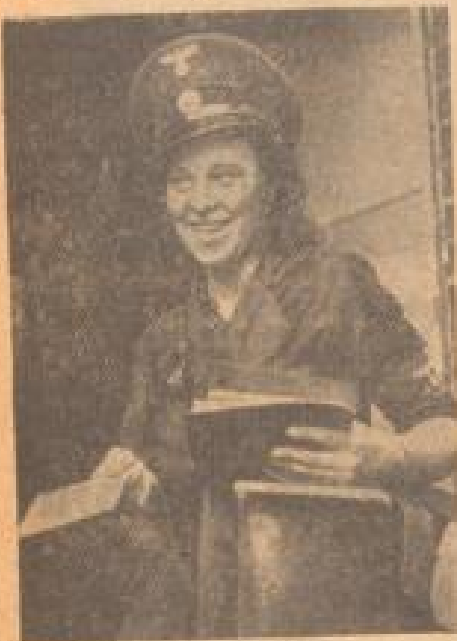
Die Deutsche Frau im Arbeitsdienst. Hier ist sie nicht, wenn er von einer in unvollständiger Weise erzählt (Mittwoch, 20. März 1934)