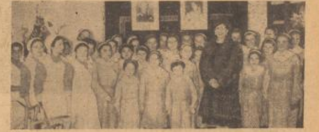
Königinmutter Helena von Rumänien beim Besuch einer Arbeiter-Heilungsanstalt...