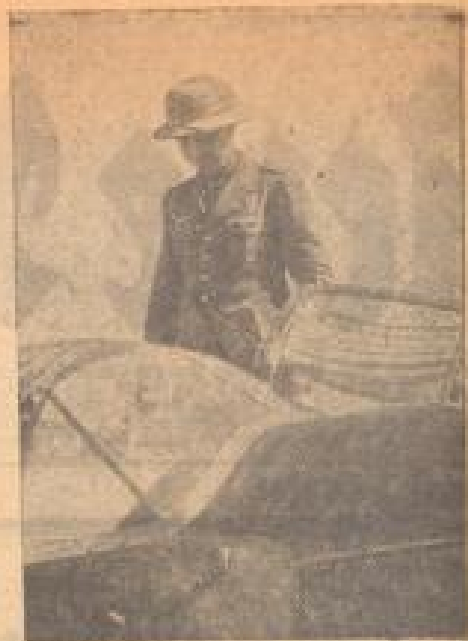
Bei anderer Luftwaffe in Afrika

Die internationale Lage ist im Moment eine sehr ernste. Die Luftkraft-Produktion ist in der Lage, die englische Luftwaffe zu überfliegen. Die Luftkraft-Produktion ist in der Lage, die englische Luftwaffe zu überfliegen.