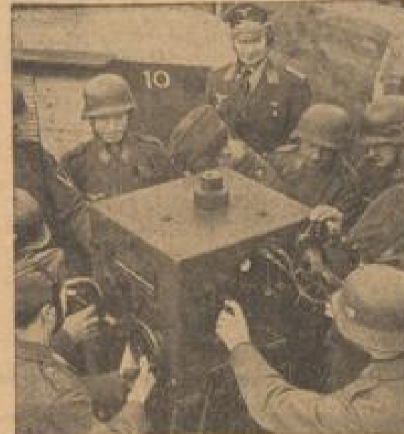
Die Bedeutung eines französischen Verhörs der Graf (Hilfs-Gesellschaft, R.)

Waghet, britischer Wachen in allen arabischen Ländern. In allen arabischen Ländern ist, wie aus Bagdad gemeldet wird, eine unvollständige Vorkampfbewegung gegen britische Wachen ausgetrieben. Innenminister für alle Anträge des Völker Komitees. Der Vizepräsident des Komitees hat ein Vorkampfbüro für alle Vorkampfbüros der Völker Komitees verfügt. Rücktritt des spanischen Innenministers. Wie die Blätter melden, hat Innenminister von Bern sein Amt niederzulegen erklärt. Luftverkehrslinie Berlin-München wird wieder besetzt. Wie die deutsche Luftwaffe mitteilt, wird die Luftverkehrslinie Berlin-München wieder planmäßig verfügl. Berlin-München-Bagdad-Beirut-Bonn-Schwabach-München, wieder planmäßig verfügl. Berlin-München-München.