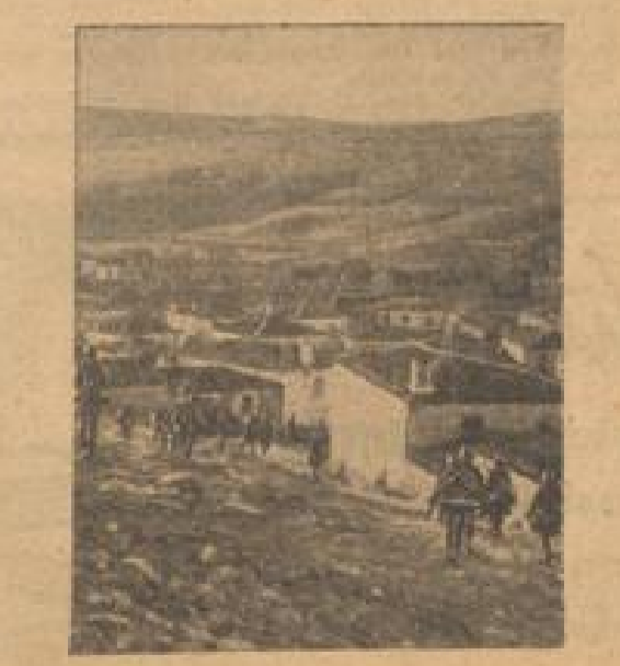
Es wurde die 12000 Mann besetzt. Die Nationalregierung der spanischen Regierung ist in der Luft ein. (Hilfs-Gesellschaft, R.)

Das Militärgericht von Clermont-Ferrand hat in einer weiteren Sitzung eine Anzahl von Unteroffizieren und Mannschaften, die beschuldigt waren an der Bewegung de Gaulles übergetreten zu sein verurteilt. Es wurden verurteilt: vier Personen zum Tode, 12 zu lebenslänglichem Zuchthaus, 6 zu 10 Jahren Gefängnis und 20 Jahren Haftstrafe, 16 zu 10 und 10 zu 1 Jahre Gefängnis. Die schwereren Strafen wurden im Anbetracht der Angelegenheiten ausgesetzt.