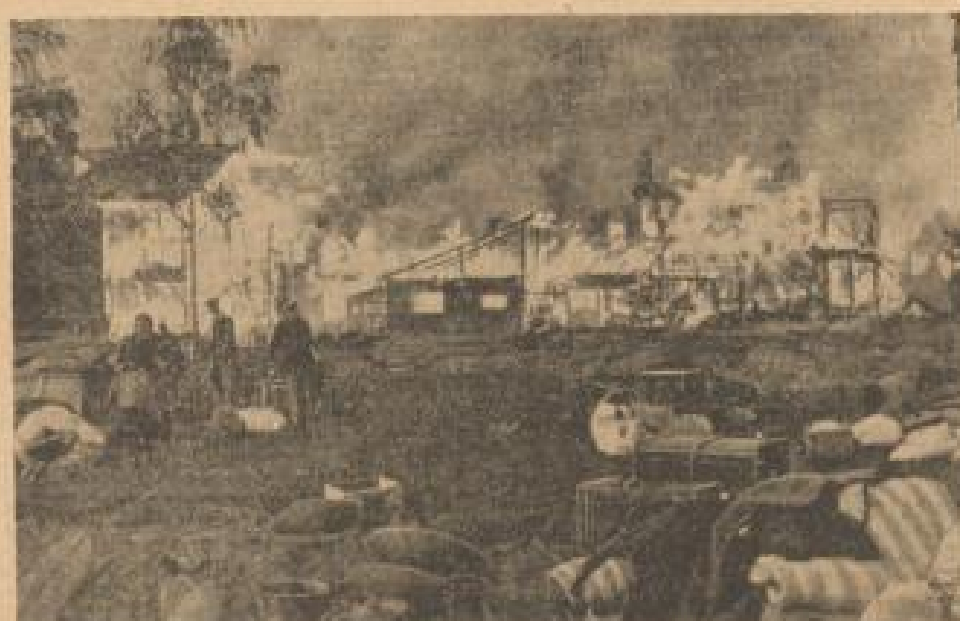
Dies war ein Szenario von Leningrad

Die deutsche Infanterie hat in den letzten Tagen die sowjetische Front durch Bomben vernichtet und weitere durch harte Beschützung ebenfalls schwer verletzt.