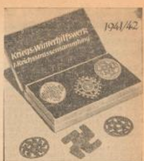
1. Reichstrahnenfammlung im Kriegswinterhilfsverein 1941/42