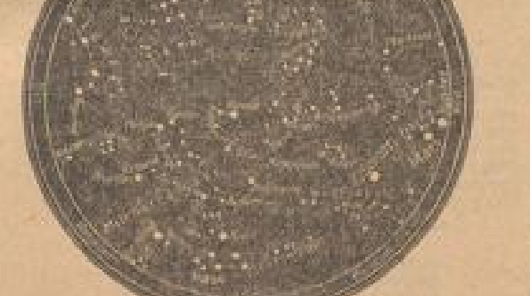
Blick auf den Januarnachtstern