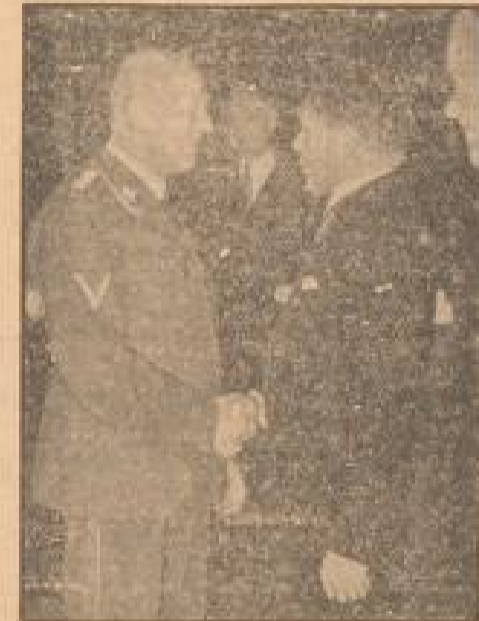
Jahrestag der slowakischen Selbständigkeit

Von deutsches U-Boot trifft nach erfolgreicher Feindsahrt wieder im Heimathafen ein. (Vgl. Bericht, Freitag-Blitz-Zentrale, Sonder-Multiplex, S.)