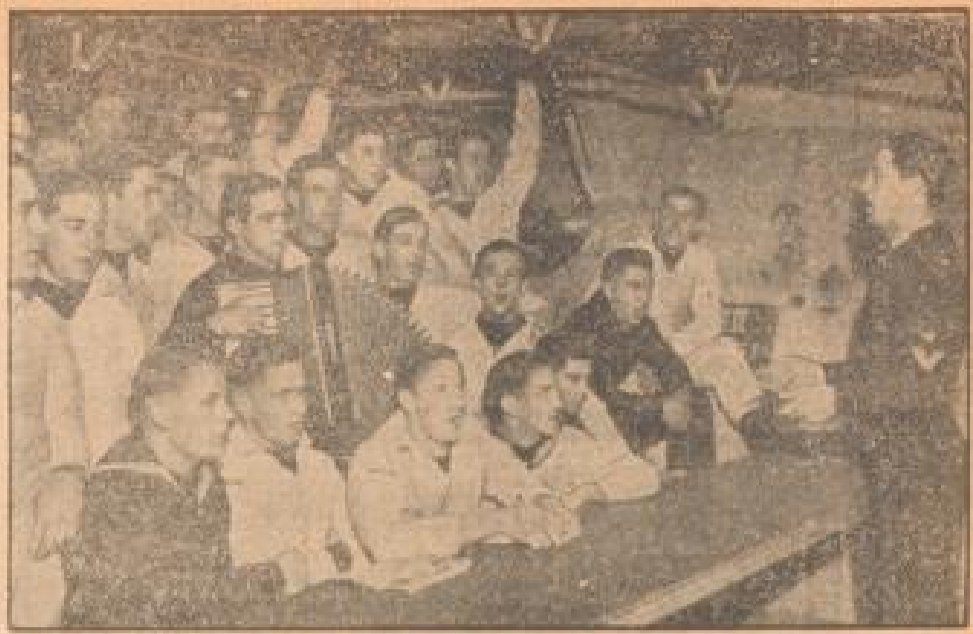
Auf einem deutschen Schlachtschiff

Spanien läßt die Gibraltarfrage nicht mehr zur Ruhe kommen. Auch der Sonntag fand wieder in ganz Spanien im Zeichen der Bombardierungen der spanischen Flotte auf Gibraltar. Die Verhöhnung