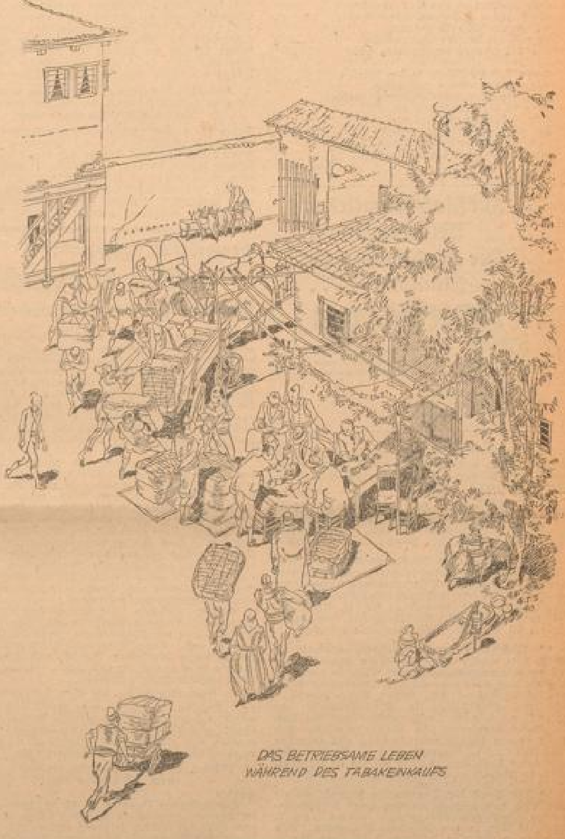
DAS BETRIEBSAME LEBEN WÄHREND DES TABAKENKAUFS

Dieser Geist der innerlichen Ausgeglichenheit und des Gleichmasses spiegelt sich auch in den Bildern wider, die den Lebensraum des Tabakbauern beschreiben.