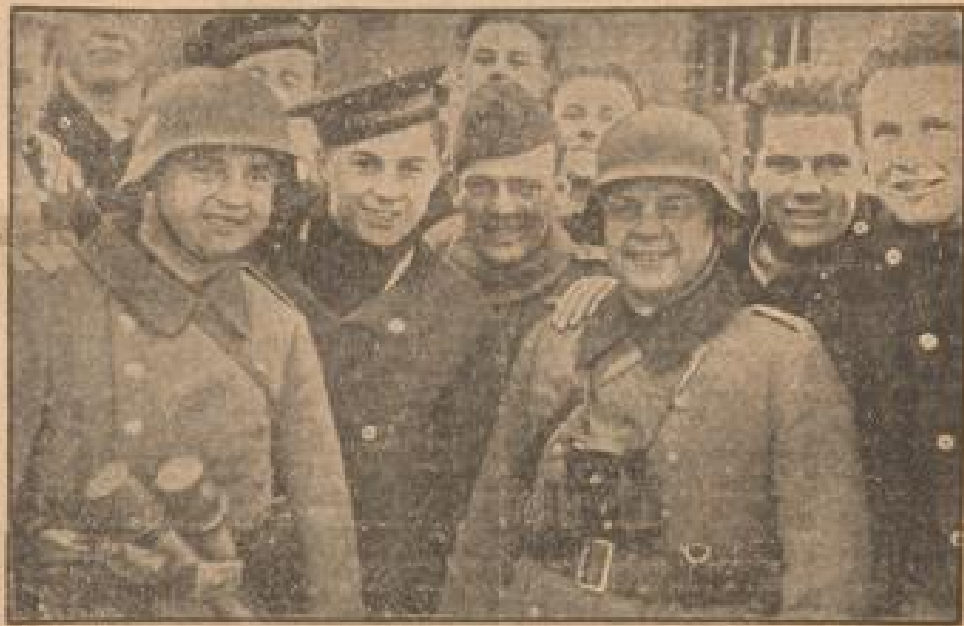
Dänische Matrosen mit deutschen Soldaten

(R. Sängler, Preis-Dorfman, Jander-Platz-2)