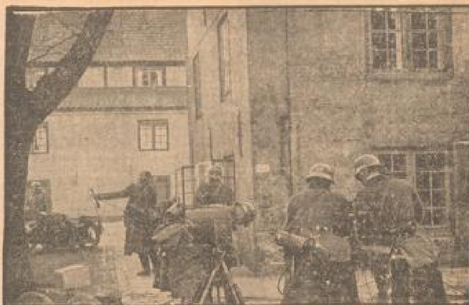
Die Besetzung der Zitadelle in Kopenhagen

In Italien wie in den Vereinigten Staaten hat sich der gewaltige Eindruck bei ihren Augenblick und dadurch verleiht, daß die alliierten Propaganda in ihrer Not der Bewegung zur See jene ansehnlichen Banden anbietet, die Chardil so prompt und schnell preis- geben mußte.