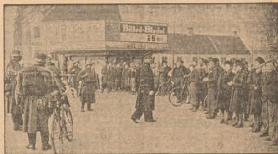
Deutsche Soldaten nach dem Einrücken in eine Straße in Kopenhagen

Unter Bild zeigt deutsche Soldaten unmittelbar nach der Besetzung innerhalb der Zitadelle. (Ebel, Bildbeleg, Jander-Platz-2)