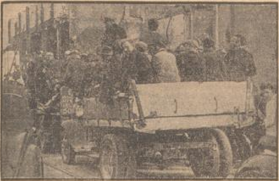
Wiederanbau Notterdams unter deutscher Führung

Im Rahmen einer Besichtigung der Deutschen Reichsbahn in Hannover vor 7000 Teilnehmern (Dressel-Gollmann, Sonder-Multiplex-R.)