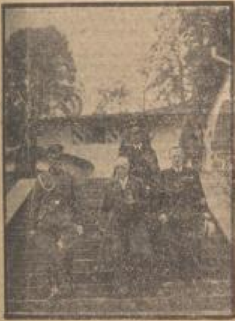
Spaniens scheidender Vizekönig Admiral Marquis de Nagaz