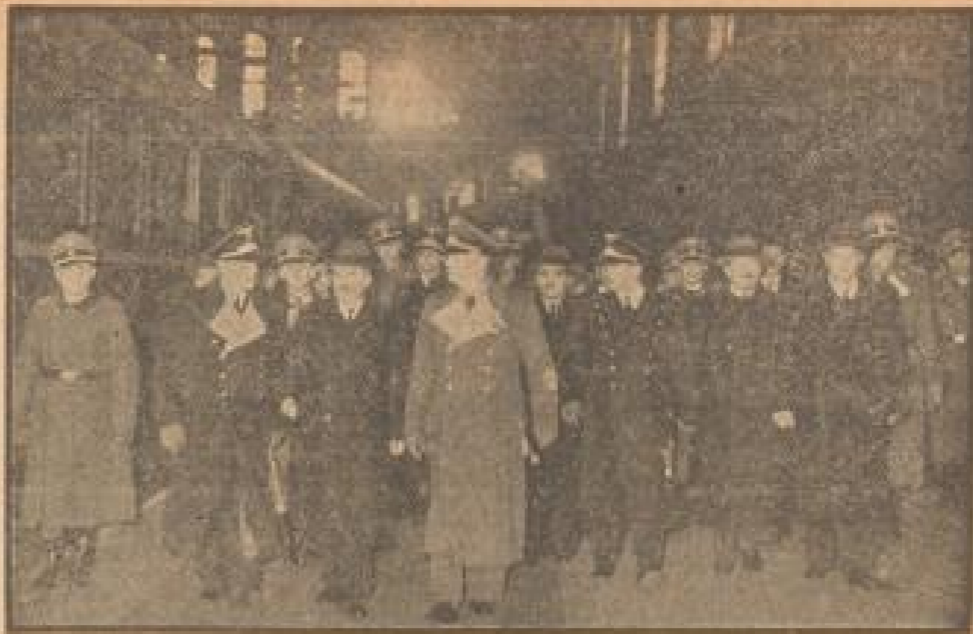
Polizeiwache Mitglied von Berlin

Deutschland hat die Macht der englischen Regierungsgewalt, Griechenland im Stich zu lassen, nicht