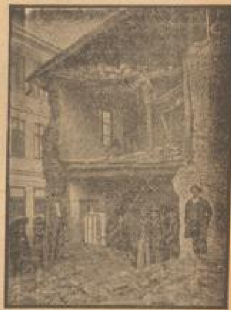
Ein vom Erdbebenstöße zerstörtes Wohnhaus in Bukarest