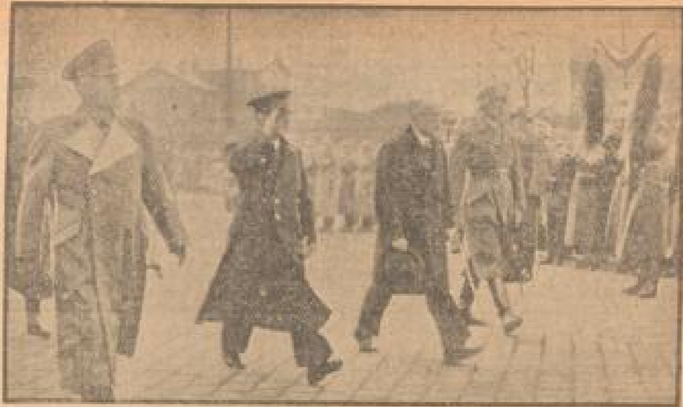
Beitritt Ungarns zum Dreimächtepakt

Die italienischen Berichte aus Rhodos kennzeichnen den Vorfall nicht als militärische Operation, sondern als „Piratenüberfall“.