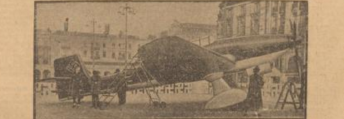
Hamburg nagelt Stuka-Modelle