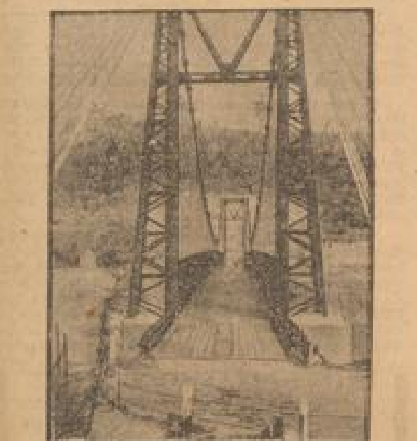
Die Burmastraße wieder bombardiert