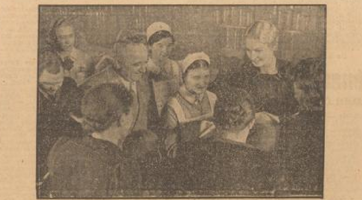
Dr. Ley behert Bergmannsfinder