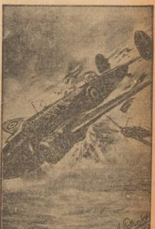
Von den Feuerlöschern einer „Me 109“ in den „Bach“ gejagt

Weshalb bei Roosevelts Präsident Roosevelt hatte den neuen Vorkriegsminister der Vereinigten Staaten in Frankreich, Admiral Leahy, zu einer längeren Unterredung empfangen, in deren Verlauf er ihm die letzten Bedingungen für seine Mission in China ermittelte.