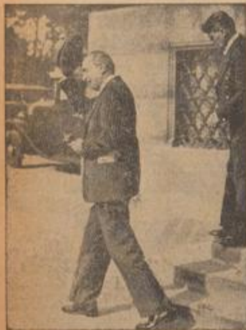
Der deutsche Botschafter besuchte Außenminister Bonnet Der deutsche Botschafter in Paris, Graf Helldorf, besuchte den Außenminister Bonnet.