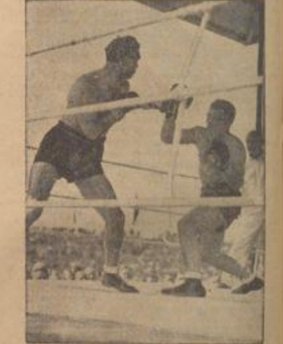
Schmeling und Genler im Kampf

1. und deutscher Säbelmeister Eisener (Deutschland) 1:3. 2. Rietzel (Schweden) 1:3. 3. Rietzel (Schweden) 1:3. 4. Rietzel (Schweden) 1:3. 5. Rietzel (Schweden) 1:3. 6. Rietzel (Schweden) 1:3. 7. Rietzel (Schweden) 1:3. 8. Rietzel (Schweden) 1:3. 9. Rietzel (Schweden) 1:3. 10. Rietzel (Schweden) 1:3. 11. Rietzel (Schweden) 1:3. 12. Rietzel (Schweden) 1:3.