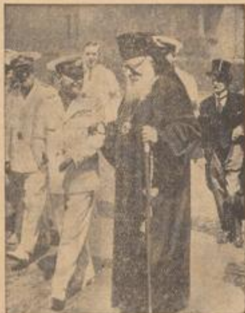
Der neue Patriarch von Rumänien Die nationale Kirchenversammlung in Bukarest wählte den Erzbischof von Jassy, Miklos, zum neuen Patriarchen Rumäniens als Nachfolger für den verstorbenen Patriarchen und Kirchenobersten Miron Cristea.