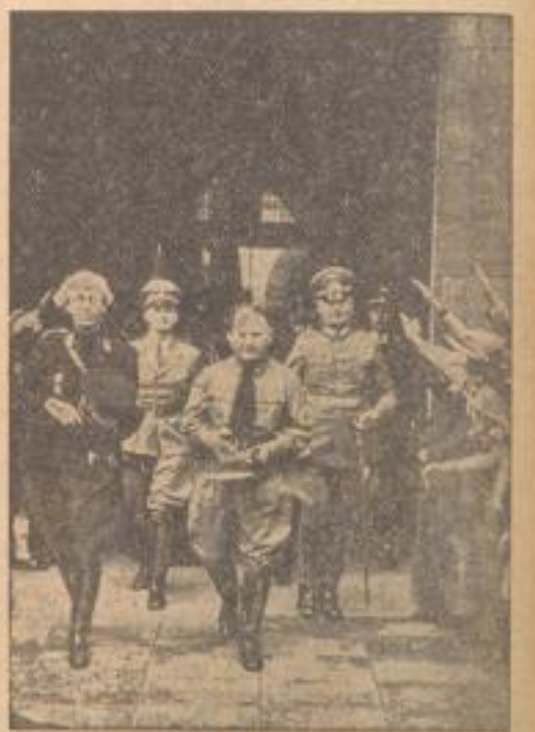
Den Veranstaltungen des Sonntages am Westwall

Die kamen zum Sonntag nach Kaiserlautern