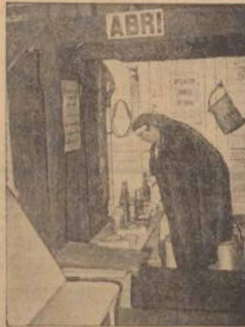
Propagandazug des französischen Luftschiffes Auf dem Pariser Flughafen lief ein Zug aus, der eine Propagandazugung durch alle europäischen Städte Frankreichs tragen soll. Unter dem Bild zeigt einen Zug in das Innere der rollenden Kugeln, in einem komplett ausgerüsteten Propagandazug.