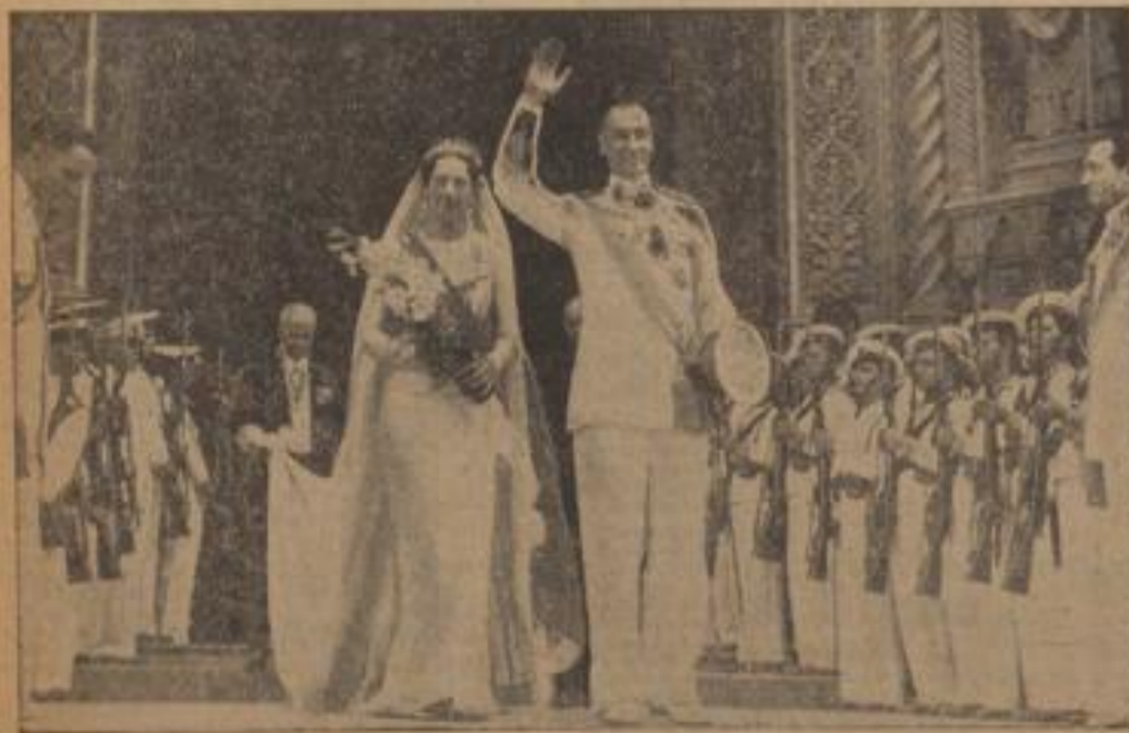
Der Herzog von Spoleto heiratete Prinzessin Irene von Griechenland Das Paar von Spoleto und Irene, die Tochter des Königs von Griechenland, wurde in Athen geheiratet.