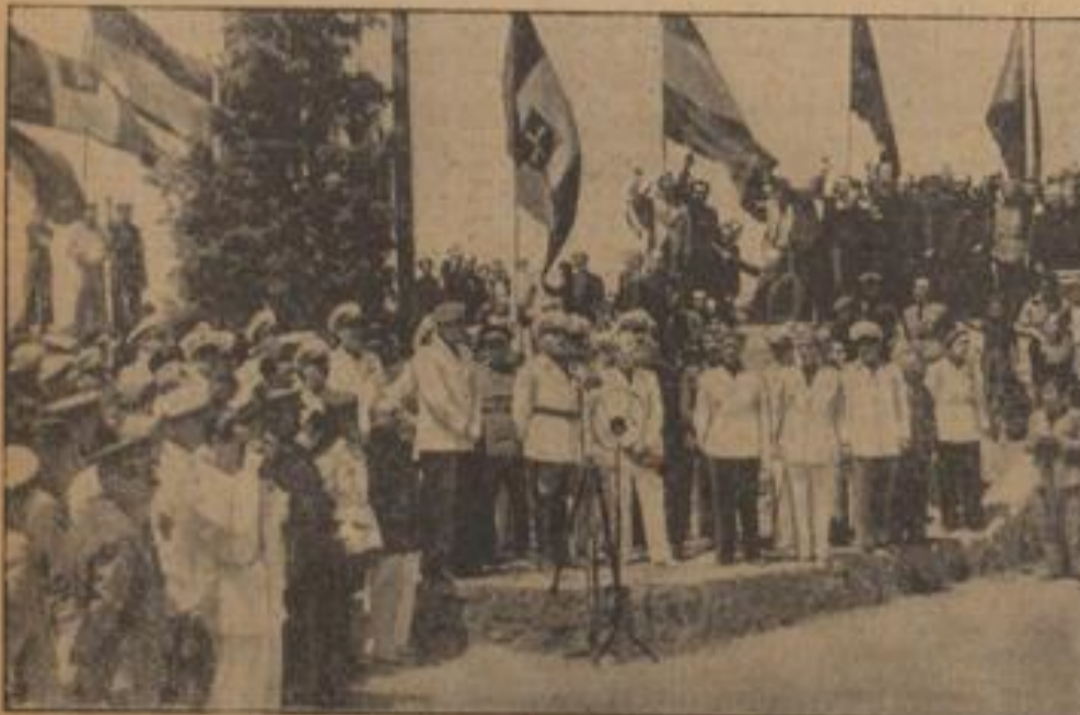
Graf Ciano besuchte Lizaraguna

Der italienische Außenminister Graf Ciano, der zur Zeit zu einem Besuch in Spanien weil- t, nahm in Lizaraguna, wo er die ostiberischen Grotten besichtigte, an der Enthüllung einer Haupt- Inschrift teil.