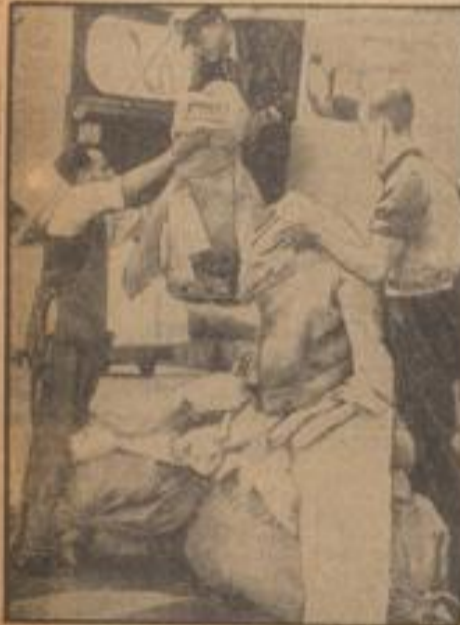
Englische Abbehangige nach Sandis Arabien

Hier werden in einem englischen Flugzeug zahl- reiche Abbehangige verfrachtet, die nach Sandis- Arabien gehen sollen.