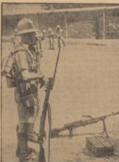
Die Engländer in Tientsin

Ein britischer Soldat in der von den Japanern durch Schiedsgericht abgeriegelten britischen Nie- derlassung.