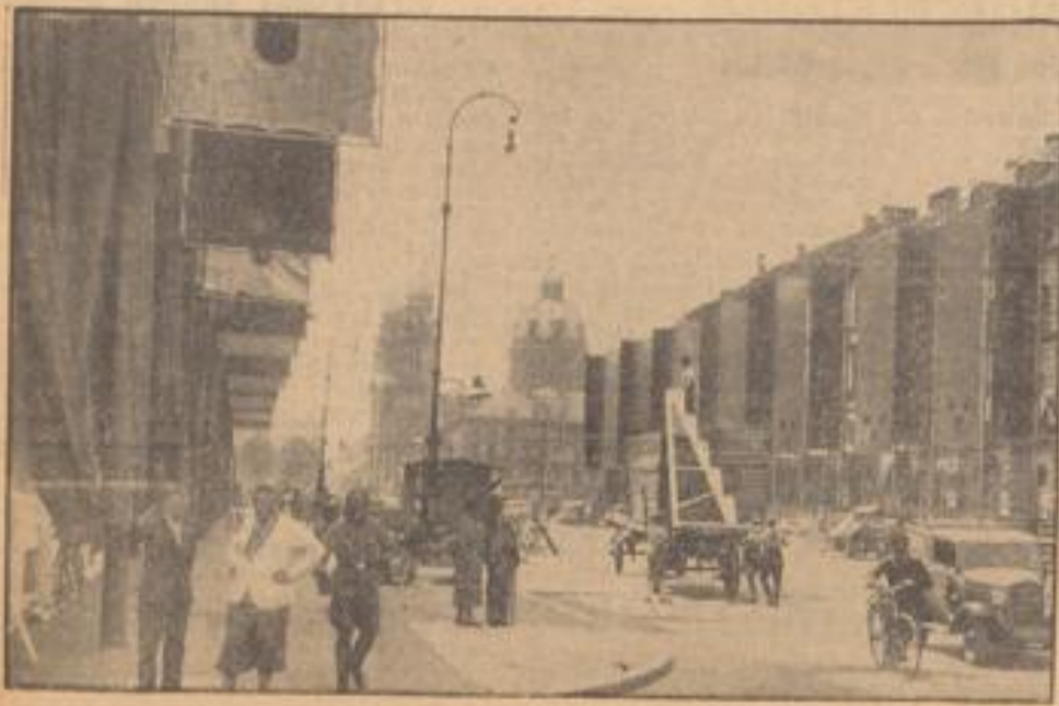
München bereitet sich auf den „Tag der Deutschen Kunst“ vor