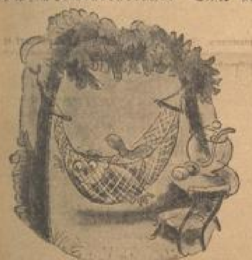
Hängematte und Erdbeerbonnie. Dieser dieser schreckliche Traum, ich war ein Fische! (Zeichnung von Theo Gersch (Zabel-M.)

In dem er mit, einer Vorstadt von London, ist ein Mann, der seinen Lebensunterhalt auf eine Weise bezieht, die in einer Fabrik dieses Ortes wird der bekannte englische Landwirt genannt. Er der Schinken — den Raucher kommt er zum „Schinkenmacher“ dieser nicht