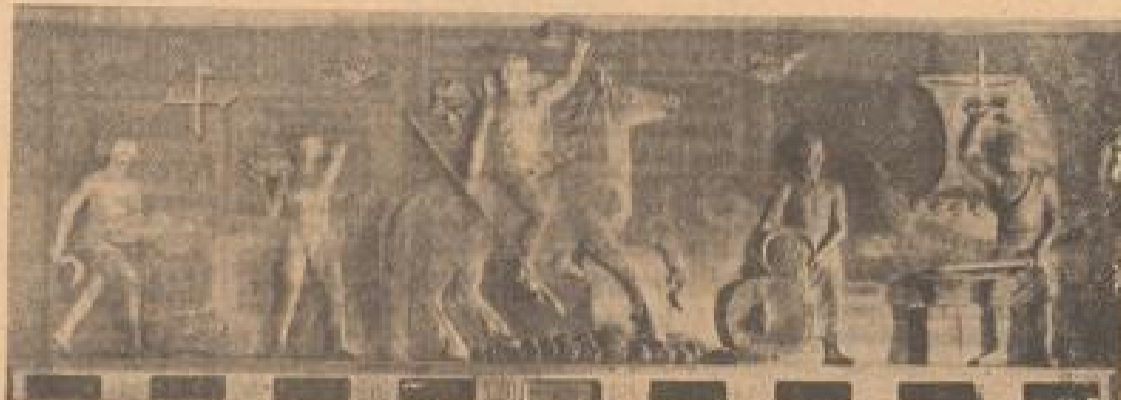
Der Fries im neuen Großmarktsaal

des Marktes seit einigen Monaten etwas nachgelassen hat, in dürfte bei einer bald zu erwartenden Steigerung dieser Hemmnisse das Interesse am Großmarkt ganz von selbst wieder zunehmen. Es ist daher zu Beginn der neuen Ernte mit einem verstärkten Besuch und mit einer Ausweitung der praktischen Geschäftsmöglichkeiten zu rechnen. Es ist vor allem zu beachten, daß die führende Stellung des Mannheimer Großmarkts nicht nur im Weizenhandel, sondern ebenso auch im Braugerstenhandel unangefochten ist. Es dürfte in Deutschland kaum ein anderer Großmarkt vorhanden sein, an dem die Geschäftstätigkeit in diesen Getreidearten die am Platze Mannheim überwiegt. Diese führende Stellung