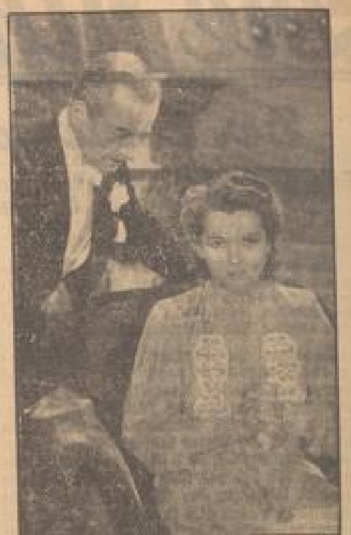
Die Eheleute und Frau Dand...

Ein schweres Gewitter, das sich am Montagmorgen über London entlief, war von solchen Regenmengen begleitet, dass an verschiedenen Stellen der englischen Hauptstadt Überschwemmungen entstanden.