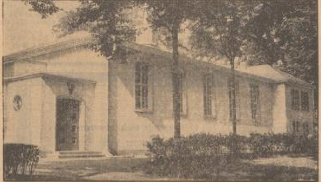
Eingang zum Großmarkthof im Friedrichsplatz

Am Schluß gab der Redner der Hoffnung und Erwartung Ausdruck, daß sich ein besseres Verständ-