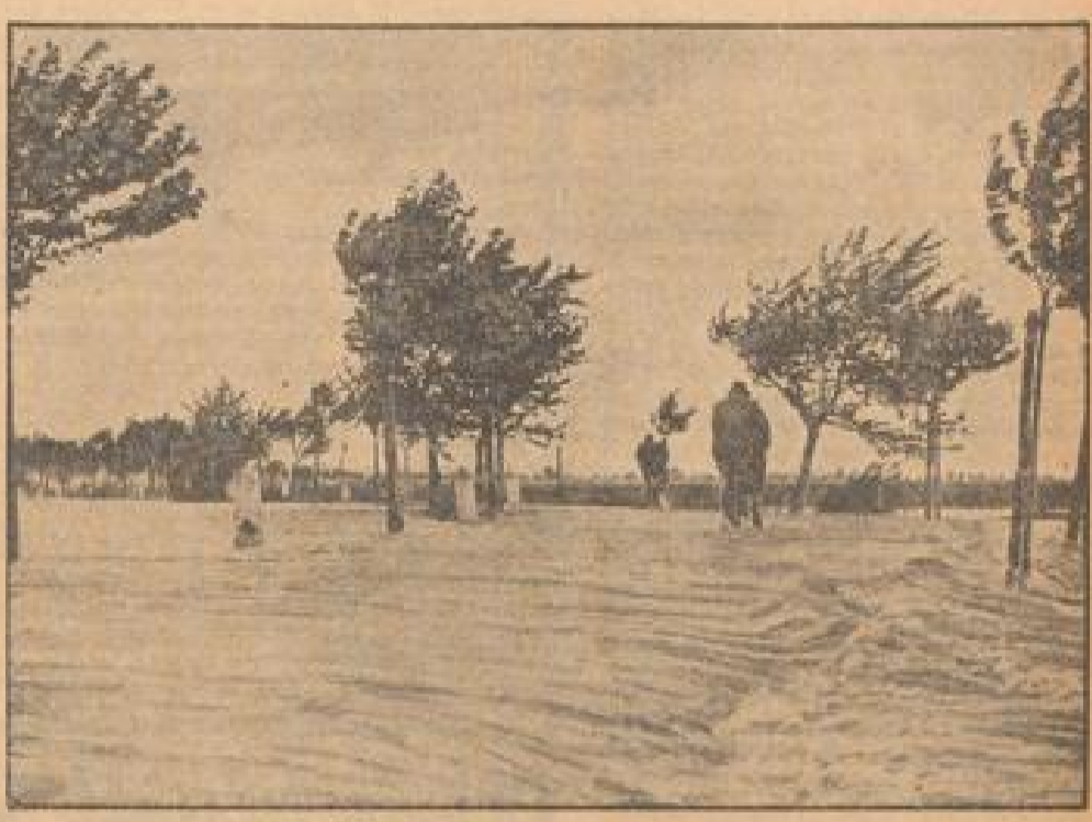
Große Überschwemmung in Oberschlesien. Ueber dem Gebiet von Ratibor gingen schwere Regengüsse nieder, die ein riesiges Gewände unter Wasser setzten und in Hochwasser in der Oder führten. (Zeitung Bildbericht, Sonder-Nr.)