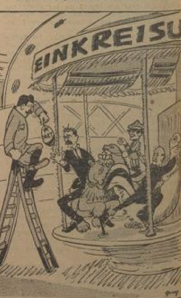
Der große Kummel. Es geht um die Buch. (Wort, Jander)

Erst als ich in die Stadt von dem Erdbeben und wie sich die Stadt vor dem Erdbeben