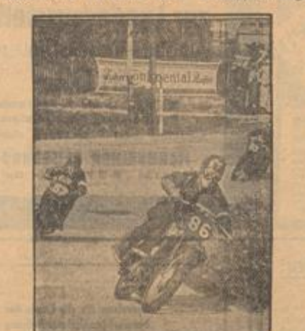
Am den „Grafen Preis von Deutschland 1939“ auf der Motorradstrecke in Garmisch-Partenkirchen.

Die deutsche Mannschaft hat eine Antwort auf die Herausforderung des norwegischen Verbandes abgegeben. Die deutsche Mannschaft hat eine Antwort auf die Herausforderung des norwegischen Verbandes abgegeben.