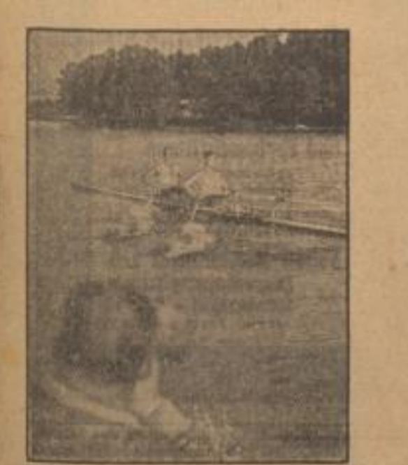
Bestes Training in Garmisch

Bei festem Wind, der als ungewöhnlich einseitig einsetzte, wurde die erste Hinfahrt des Amicitia-Nachter gewonnen. Die Ruderer der Amicitia-Nachter gewannen die ersten beiden Vorläufe.