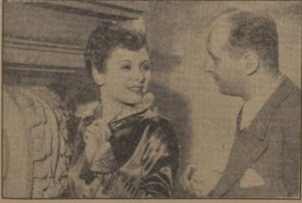
Der Spitzmeister vor der Kamera