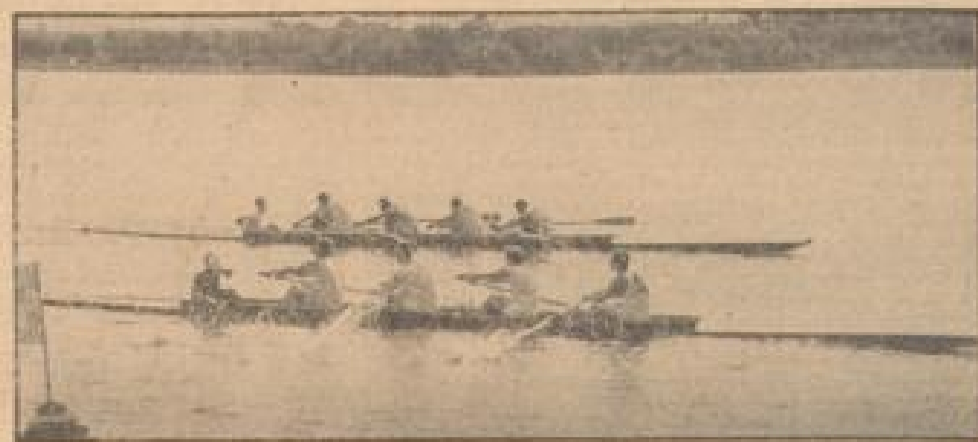
Spannender Endkampf der Ruderboote auf dem Maßsee

Auf dem Maßsee bei Hannover wurden unter großer Anteilnahme des Publikums Rämpfe um die deutschen Meisterschaften ausgetragen. Unter Bild zeigt den Sieg im Vierer, den Mannschaftsmitgliedern der Germania Hildesheim errang.