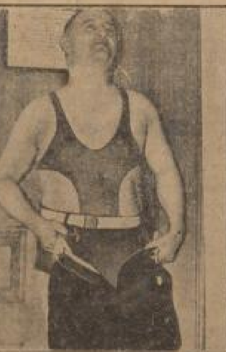
Parlamentssitzung im Bodensee?

Das „Fleur-Fest“ in Cannes-Frankreich an der französischen Riviera erobert auch in diesem Jahre mit einer großen „Blumenfest“.