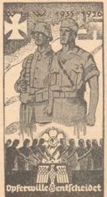
Das Kampfbild des Mann Mars