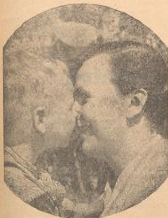
Mutter und Kind — nie können die Herzen zweier Menschen so schön zusammenklagen

Das Heldenlied der Mutterliebe — Mütter errangen Unsterblichkeit Im Mittelpunkt der deutschen Familie: die Mutter