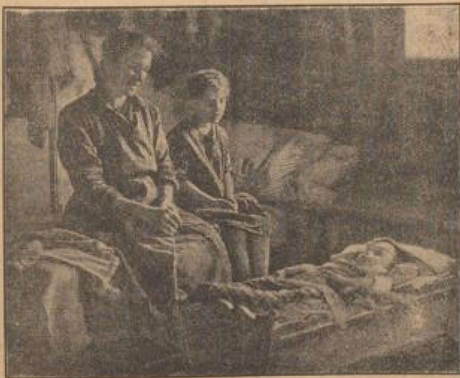
Augen voller Harm, Hände, die schwere Arbeit verraten, aber im Anblick das stille Leuchten des Mutterglücks