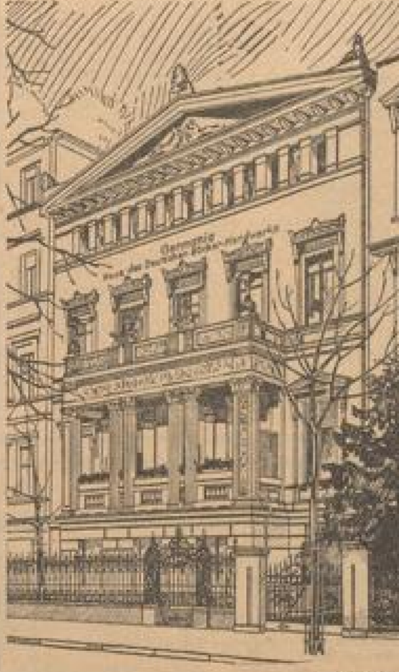
Das Haus des Reichshandwerksverbandes in Berlin

Durch die Wechsellagen des Handwerks sei die Lage im Handwerk in letzten drei Jahren auch sehr besser geworden. Man sei sich hier darüber, daß mancher Handwerksmeister die Gefahr, die ihm der Staat im Interesse der Allgemeinheit auferlegen könnte, nicht hätte bringen können, wenn die Front nicht so klar ausgerichtet gewesen wäre.