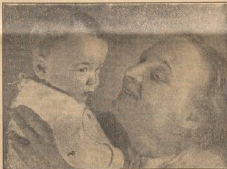
Die Mutter wirbt um das Lächeln des Kindes ihr ganzes Leben lang

Hermann Hesse, legt der Mutter zarte Worte für sorgender Liebe in den Mund: „Da gehst du neben mir wie leiser Schritt: Ich bin's, ich bin's, Kind, kennst du mich nicht mehr? Der lichte Tage freize dich allein; doch wenn die fernestosen Nächte