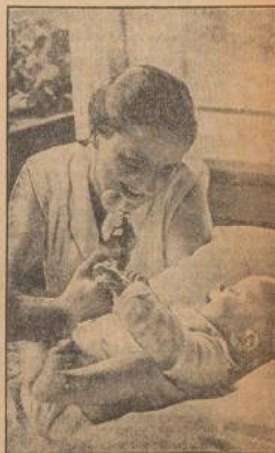
Die erste Fresse im Kinde erweckte seine Mutter Peter, Eschell (1), Müller (1), Engel (1), Monstus (1), Geller (1) — 21.

Das neue Deutschland, das alle naturgegebenen Rechte wieder eingeleitet hat, sah es von Anfang an als eine seiner bedeutendsten Aufgaben an, der Mutter zu helfen. Sie zu ehren, ihr zu helfen ist erste Vorbedingung der Erneuerung eines Volkes. Nur fröhe, hoffnungsfreudige, starke Mütter, vor denen sich ehrenhafte, schaffenslustige Männer beugen, werden gesunde, feilsch und körperlich gesunde Kinder heranbilden. Junge Menschen, die die Verehrung der Mutter im Herzen tragen und das Heldenlied der Mutterliebe singen werden. E. Birkhäuser.