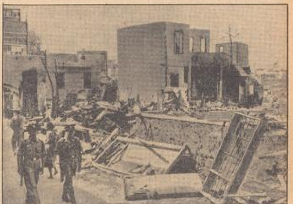
Die Zerstörung in Tel-Aviv, der jüdischen Stadt, die von der Araberarmee zerstört wurde. In der Mitte ist ein zerstörtes Gebäude zu sehen, umgeben von Trümmern und Schutt. In der Ferne sind weitere zerstörte Gebäude zu sehen. (N.M.Z.)