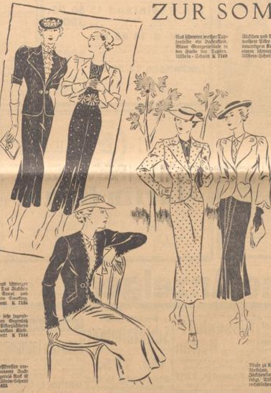
Jäckchen mit breitem Kragen. Ein hübsches Modell für den Sommer. Preis 12,50 RM. — Schnitt K 7184

Neben den strengen Schneidestilen aus Herrenstoffen haben die Sommerkleider in einem alle Erwartungen übersteigenden Ausmaß an Beliebtheit zugenommen. Zu mehreren begnügt man ihnen überall, wo sich geschickte Frauen anzuwenden sind. Mal in schwarzem, knauffeidenem Cloak, mal in weißer Ripseide mit biden Mäusen Tuffen, dann wieder in bunten Blumen- oder in Streifenmuster. Man- oder Frauen- oder in Streifenmuster. Man- oder Frauen- oder in Streifenmuster. Man- oder Frauen- oder in Streifenmuster.