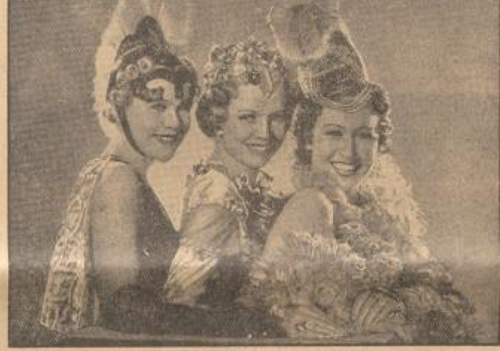
Die drei Größen von Ferrara

Die beiden Schiffsdampfer "Bremen" und "Europa" des Norddeutschen Lloyd haben in eine große Kuppel erhalten, die auf dem Dockschiff zwischen den beiden Docks verankert wurden. Bei einer Länge von 45 Metern und einer Breite von 17 Metern können sie etwa 25 bis 30 Autos aufnehmen. Die Kuppel steht bisher im Transatlantikkanal einzig bei Norddeutscher Lloyd.