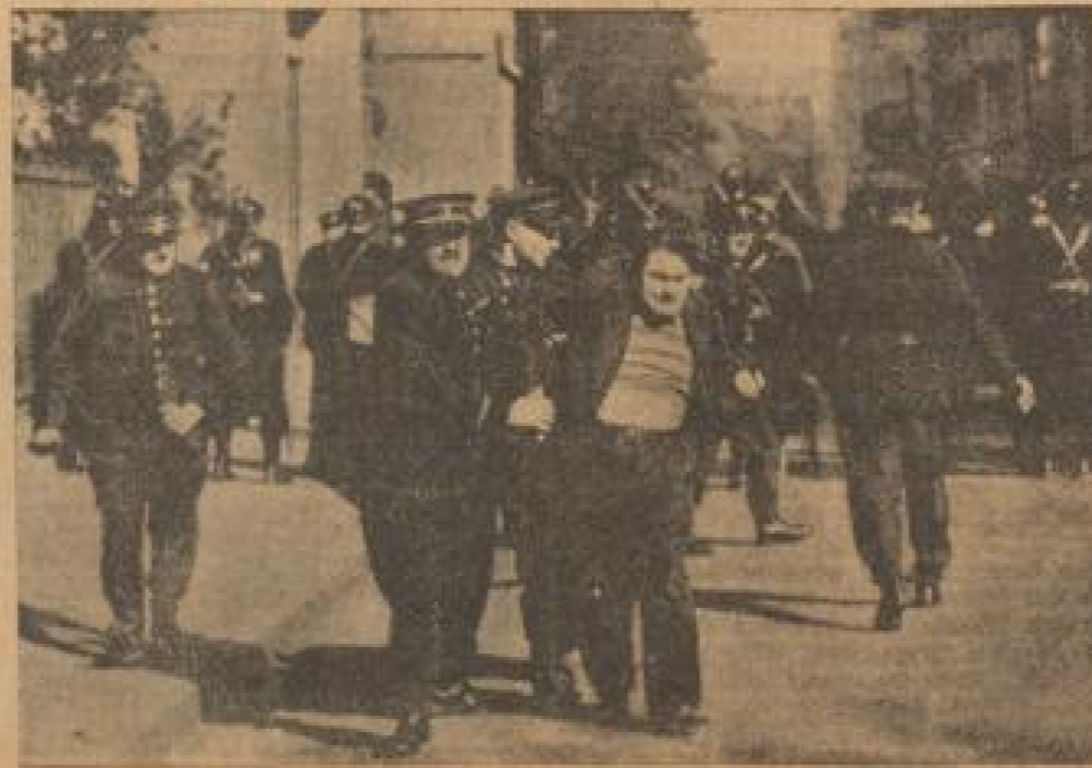
Die Demonstranten haben bei ihrer Teilnahme für den Nationalismus...