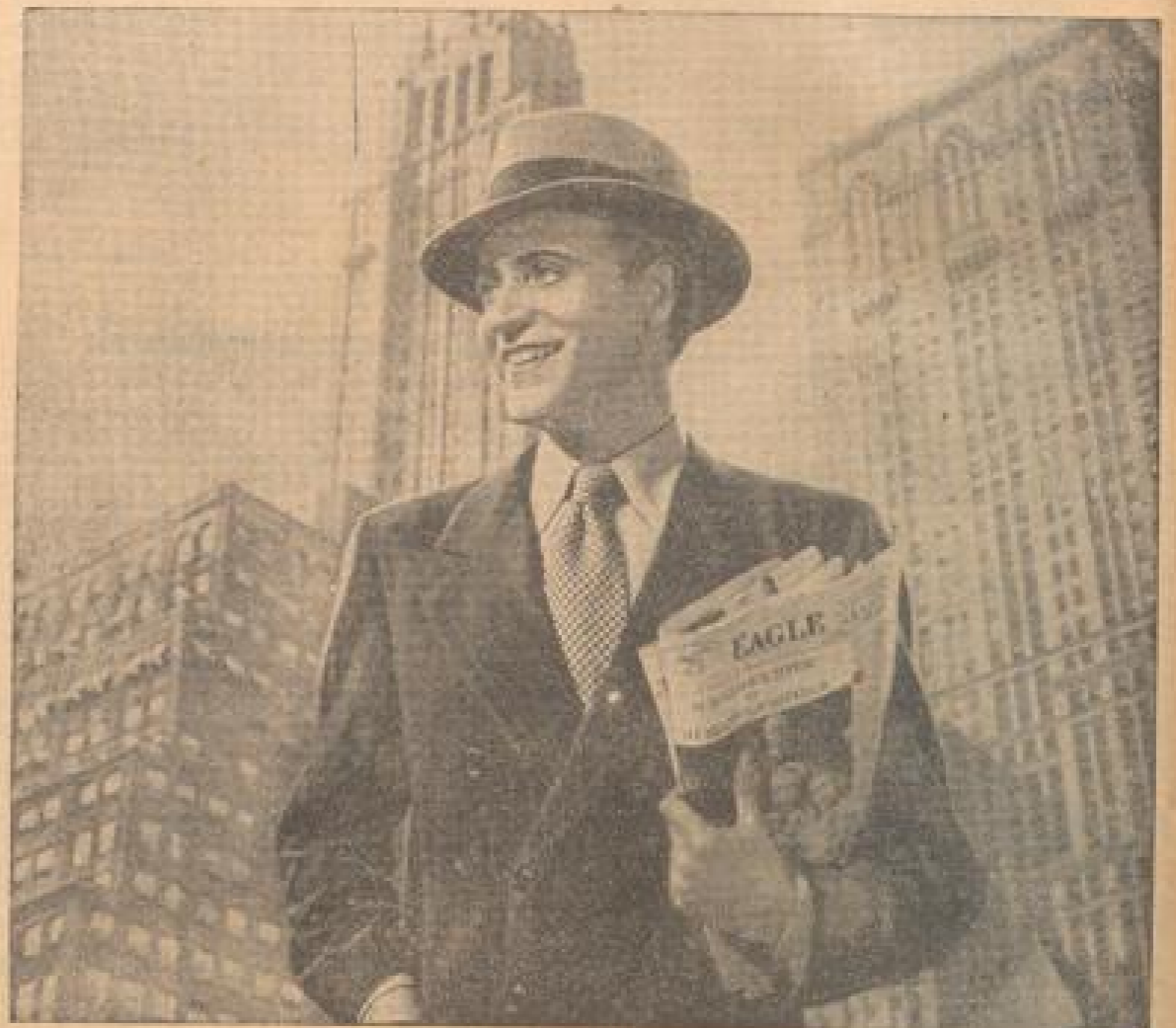
Willy Fritsch als New Yorker Reporter in dem neuen Harvey-Fritsch-Film „Glückskinder“, der im amerikanischen Zeitungs-milieu spielt.