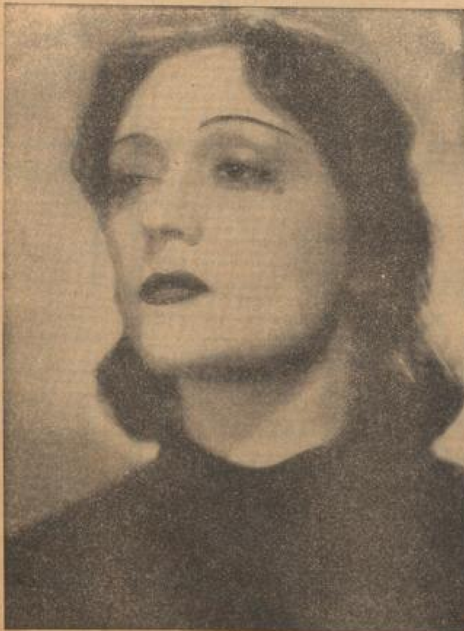
Die große Schauspielerin im neuen Film der Terra „Moskau-Schanghai“