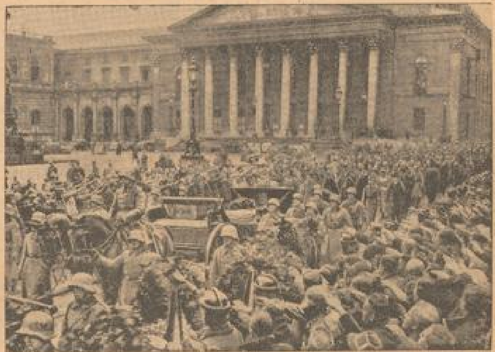
Die Beerdigung des verstorbenen ungarischen Ministerpräsidenten von der Wäandener Feldweg zum Hauptbahnhof. (Weiß, R.)

Die Pariser Regierung unter kommunistischem Druck: