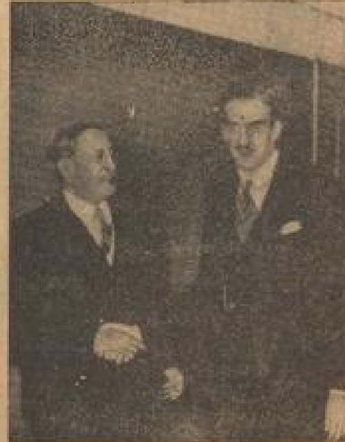
Zwei französische Ministerpräsidenten Leon Blum und der englische Außenminister Lord Halifax schütteln die Hände bei der langen Verhandlung der neuen Weltvertragspläne. (Weiß, R.)