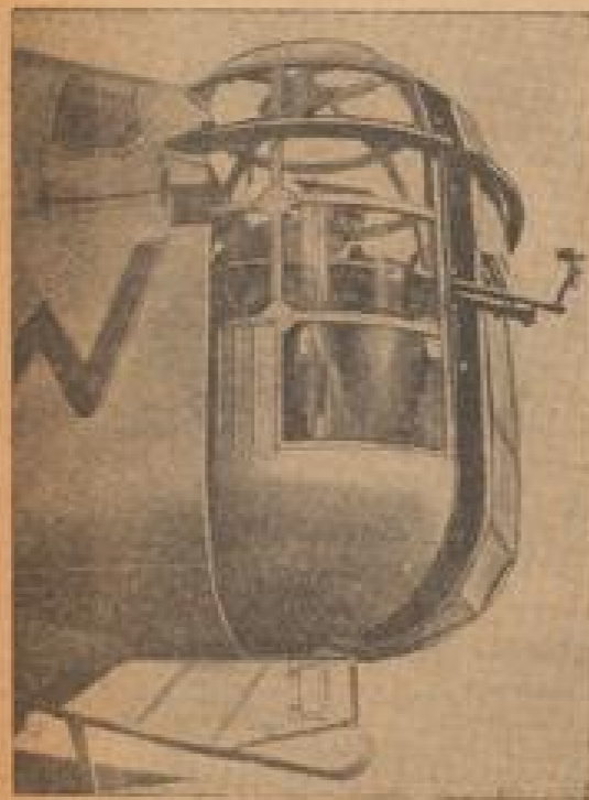
Der neue englische Bomber

In England ist eine Tankschule für die Ausbildung in dieser Spezialwaffe eingerichtet worden, in der die Schüler theoretisch und praktisch auf gründliche Ausbildung werden. Die ersten vier der Schüler beim Unterricht mit dem Modell eines Panzerwagens. (Wehrmacht, III.)