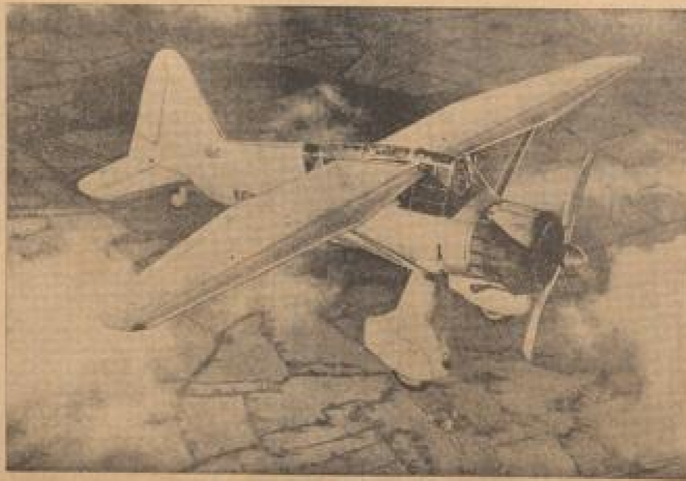
Das neue englische Aufklärungsflugzeug

Das 101. Bombenflugzeug der englischen Luftwaffe ist mit den neuesten Bombenflugzeugen des Typs „Comet“ ausgestattet worden. Die bombenbeschießbaren Motoren sind aus Aluminium und kein langer Metallstab und kein anderer Teil des Motors, der über die Luft und die Erde hinweg fliegen kann, zu verformen. Außerdem ermöglicht es noch die vollständige Besetzung eines Bombenflugzeuges. (Wehrmacht, III.)