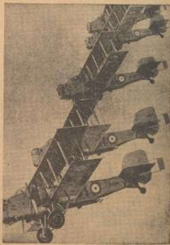
Die neuen Maschinen der englischen Fallschirmtruppe

Bei der Neuentwicklung der britischen Luftwaffe wurde jetzt ein neues Aufklärungsflugzeug in den Dienst gestellt. Das einmotorige Flugzeug hat sich bei den auf anderen Feldern getriebenen Versuchen als sehr gut bewährt. Die Maschine trägt ein Glasfenster. Ebenso ungewöhnlich ist auch die Form des Rumpfes. Der des Motors hat Schwenker angebracht. Die Schwenkbildung des Flugzeuges wird als „Schwenker“ bezeichnet. (Wehrmacht, III.)