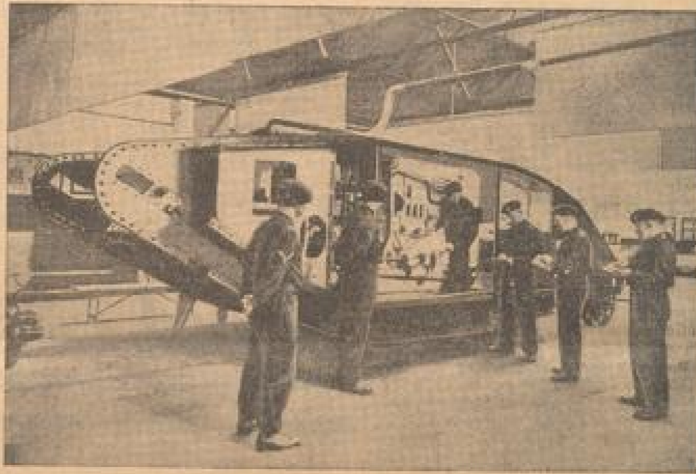
Englische Militärschule für Panzertruppen

Die englische Seemotorschiff-Bootschiff: Die Landung wird abgebrochen. (Wehrmacht, III.)