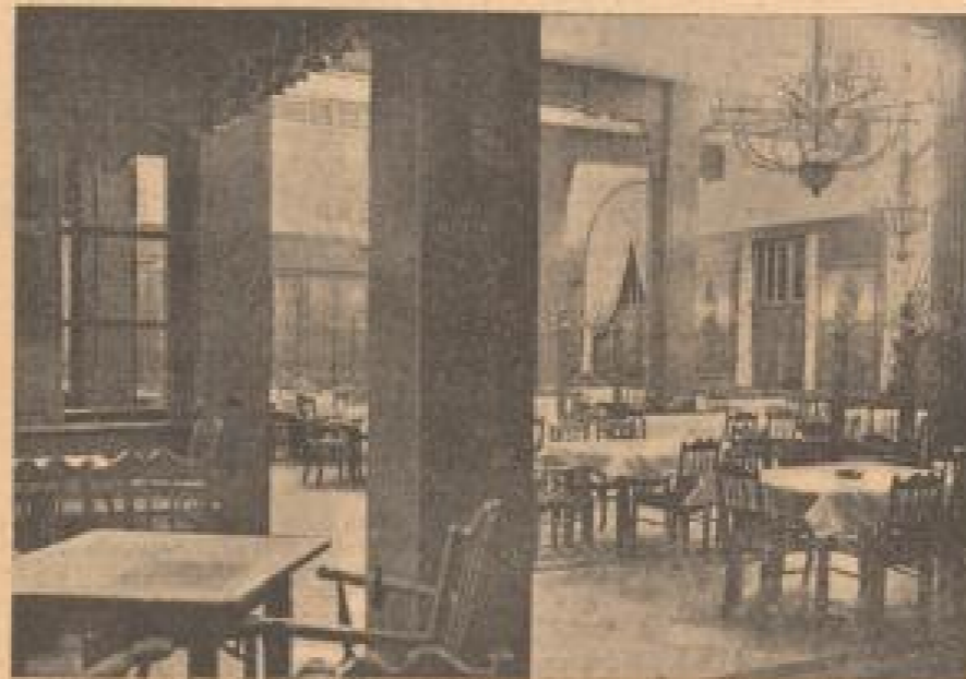
Ein Blick von der Nische in den Hauptraum

Die Küche zur Linken ist zwar geblieben, aber auch hier ist völlig Neues geschaffen worden. An der Rückwand macht ein von Kunstmalern gemaltes