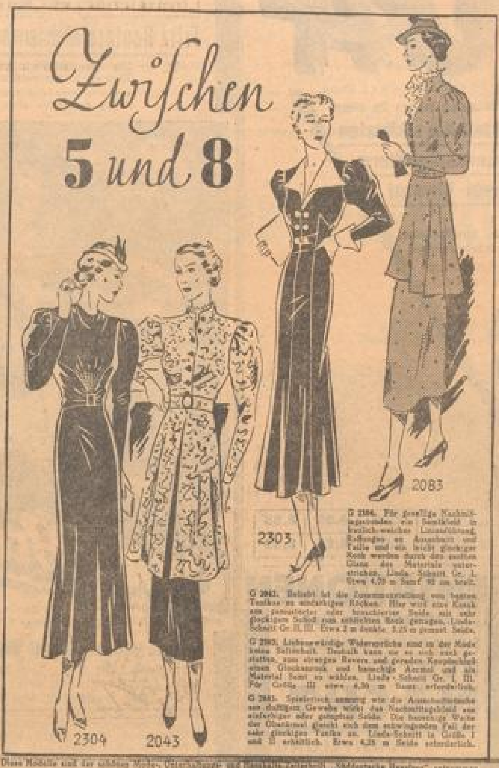
Diese Modelle sind für mittlere Körper, Unterwäsche- und Hosiery-Verbrauch. 'Schöne neue Welt' entworfen.

Krautsoße, 100g. Das Weißkraut wird sehr fein gehobelt und in eine Schüssel gegeben, mit dünnem Essig, Salz, Kümmel, Del mariniert, mit Brett bedeckt und beiseite. So muß es einige Stunden stehen. Größe gut nicht auch ein Kranz von roten Rüben dazu aus, die Bratpfannen ein gutes Abendbrot.