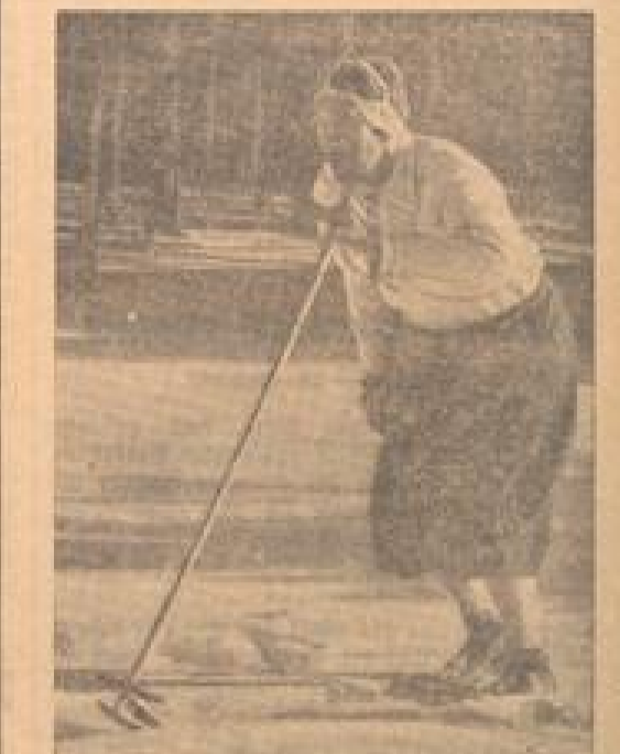
Der Kaiser-Weltmeister als Schmelzler

Die Internationale Basketballmeisterschaft in Garmisch-Partenkirchen am Sonntag. Die USA gegen die Tschechoslowakei