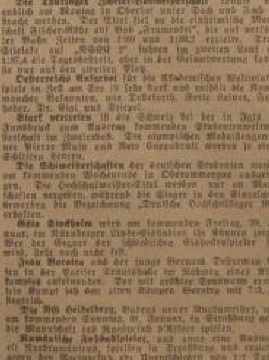
Die Internationale Basketballmeisterschaft in Garmisch-Partenkirchen

Die Einzelkämpfe der Gruppe West am Sonntag. Seckenheim — 1:0, Eintracht — 1:1, Eintracht — 1:1