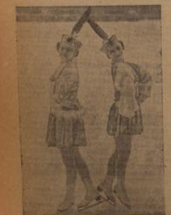
Die Internationale Basketballmeisterschaft in Garmisch-Partenkirchen

Die letzten Spiele der Gruppe DII am Sonntag. Seckenheim — 1:0, Eintracht — 1:1, Eintracht — 1:1