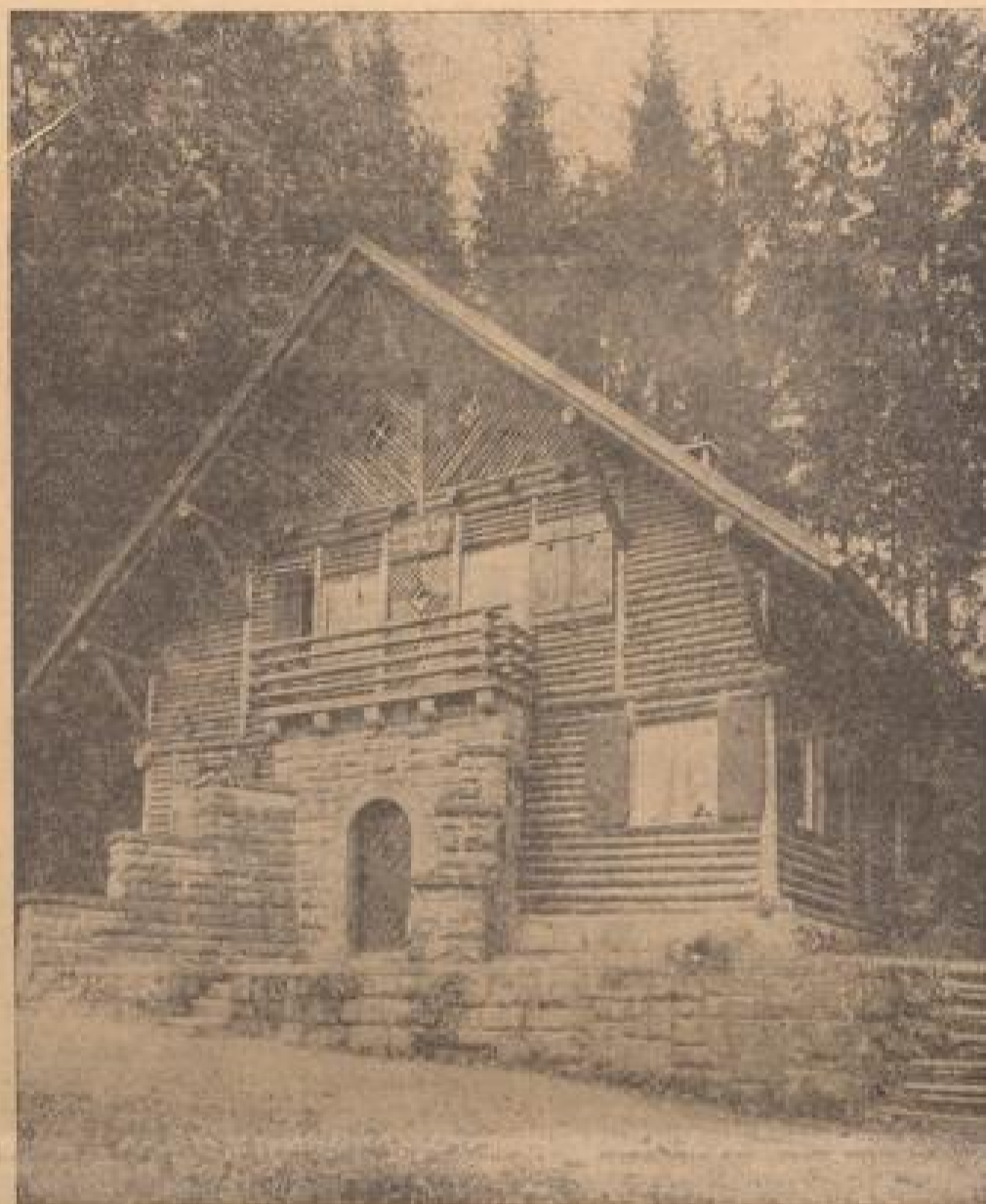
Blick auf das Hermann-Löns-Haus der HJ bei Fahrnaun