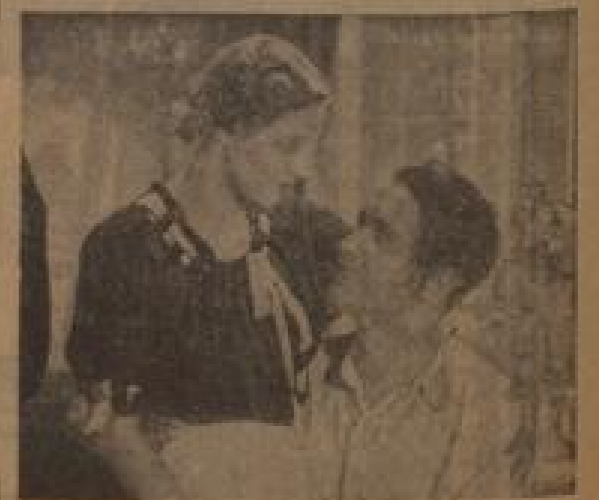
Unter dem Namen der Faschingsfeier... (Caption describing the photo)