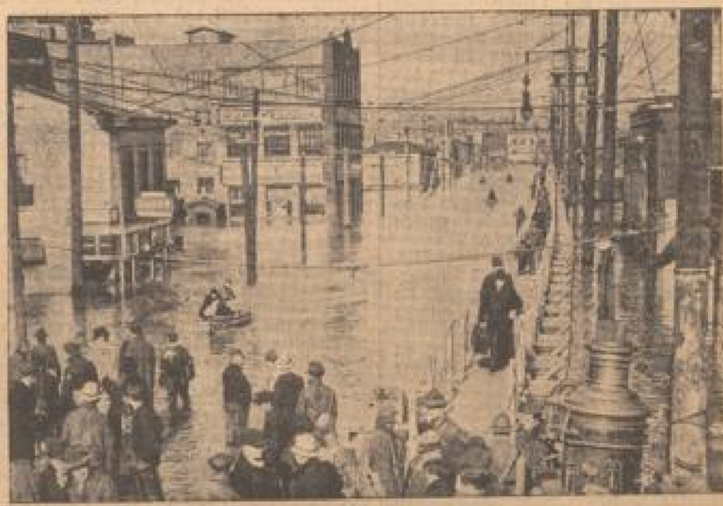
In der Stadt New York werden alle Bewohner wegen Hochwasserlage evakuiert, ebenso auch die Hochwasserkatastrophe der Küstengebiete, die sich in den Hochwasserkatastrophe befinden. (Weltbild, N.Y.)