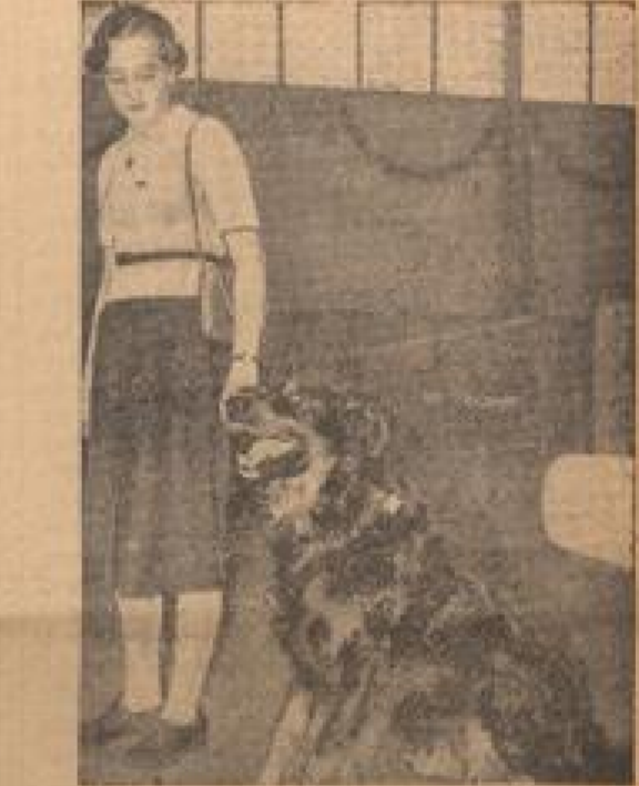
Gesamtheit der neue Hund Auf der Reichsbank in Bonn, die im Rahmen der „Graz und Glück“ zu Berlin hat, erregte die vergrößerte deutsche Ausgabe, der Gesamtheit, in dem man einen besonders interessanten neuen Hund hat. (Weißbl., R.)