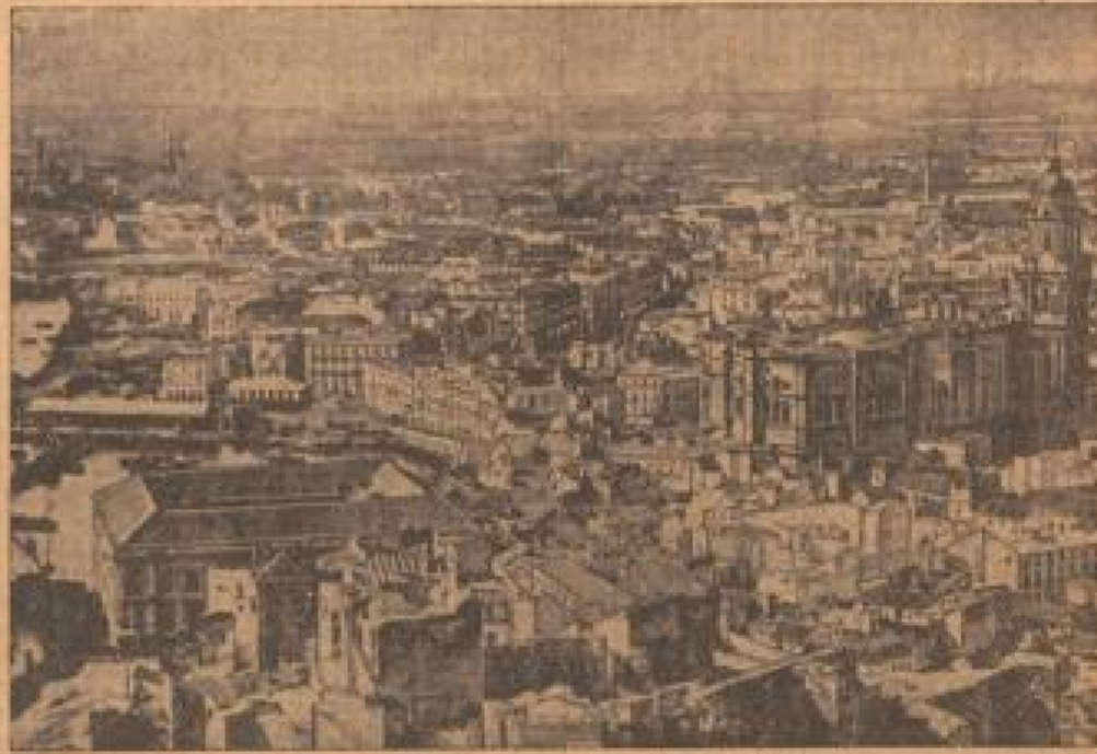
Die von der Flucht der spanischen Güterdampfer erzwungen die spanischen Nationaltruppen von Malaga nach Seles Malaga.