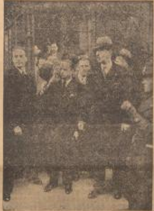
Paris gedachte des Toten am 4. Februar In der Notre-Dame-Kathedrale fand ein feierliches Gottesdienst zu Ehren der bei den letzten Anlaufmomente am 4. 2. 1934 ums Leben gekommenen Frau. Überlebens der La Rocca, der Führer der französischen Sozialisten, beim Verlassen der Notre-Dame-Kathedrale nach dem Gottesdienst.