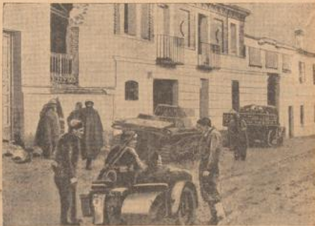
Retardierte Truppen des Generals Cortes de Maza auf dem Vormarsch nach Almeria.

verfügen, mit deren Hilfe sie sich jederzeit mit den spanischen und westafrikanischen Militärsituationen in Verbindung setzen können.