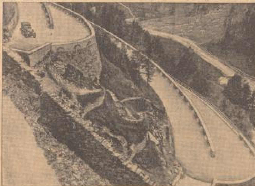
Der Park, der Winter und Frühling scheitert

gen und Reigen kühlen hier vollkommen den Süden vor. Das Schloß der feierlich-steinliche Mittelpunkt der Insel (wenn auch ausschließlich der Insel) für den Menschen des Nordens der tropische Pflanzenwelt ist, wird hoch über dem Meeresspiegel; diese Baumarten helfen für Deutschland vielbewunderte Pflanzenwunder dar, vorab die auf sechs, monatlich und vereinzelt dreißig Meter hohe Cryptomeria japonica. Diese Subtropenbäume ge-