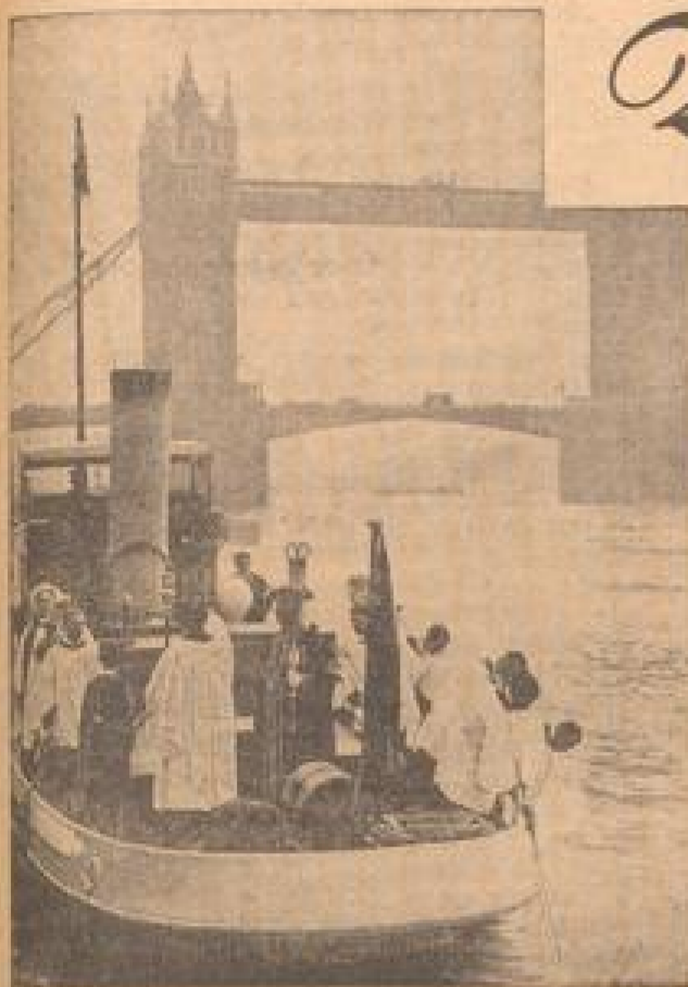
Links: Auch ein Stück englischer Tradition Als die Grenzen der Kirchengemeinde St. Dunstan im Osten Londons festgelegt wurden, geschah es in diesem feierlichen Aufzuge. Rechts: Nach althergebrachter Form wird vom Sprecher des Parlaments von den Stulen der Börse die Auflösung des Parlaments verkündet

24 Soldaten schützen die Bank von England — Die Tapferen im Tower — „Rote Richter“ durchziehen das Land — Seit 150 Jahren Harrow-Strohhut-Tradition in England