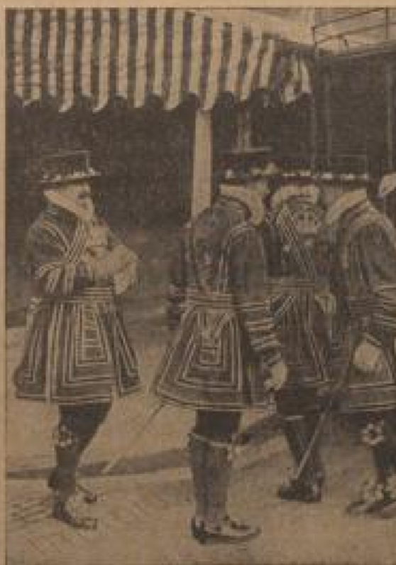
Nebenstehend: Sie forschen nach Pulver! Seit der Aufdeckung der Pulververschwörung wird jedesmal vor Beginn der Parlamentsöffnung das ganze Gebäude von den Schloßgardisten nach Pulver durchsucht.

San-Mathur-o-Rika. Bei Höhletempeln und Höhlenritzen denkt man immer in erster Linie an die berühmten Basen Koptens, Chindens und Siam, aber auch Europa besitzt in diesem Belange manchen beachtenswerten unterirdischen Bau. In Mitteleuropa galtten viele Höhlen