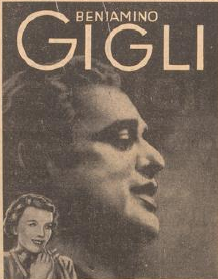
In dem neuen Großfilm der Bavaria: