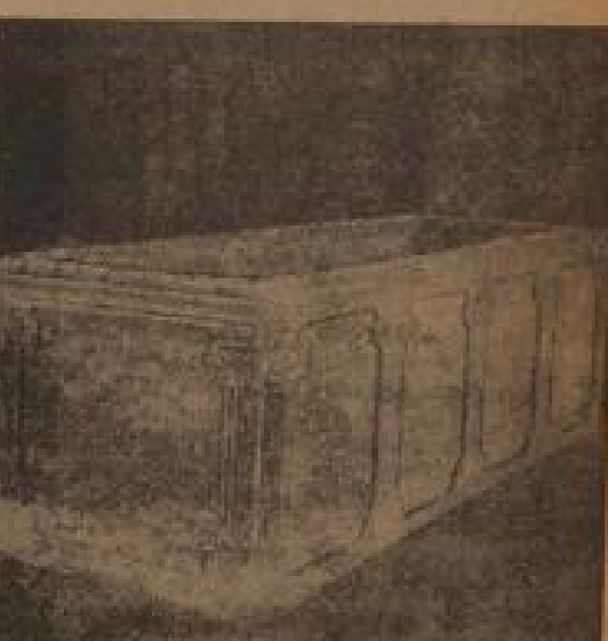
In diesem Sarkophag ruhte wahrscheinlich Ludwig der Deutsche 11.