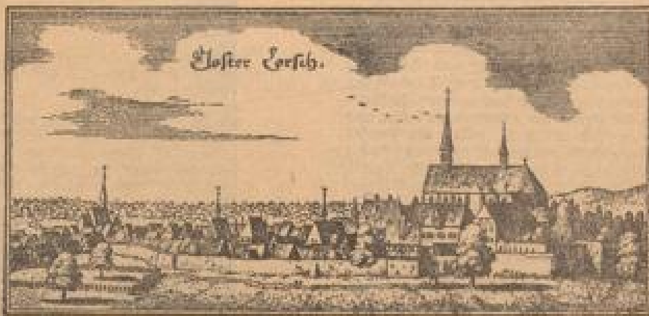
So sah Merian Anno 1645 die Klosteranlage Rechts vorne in der Mauer das Tor, dessen Fundamente jetzt ausgegraben wurden.

Die „Torhalle“ zu Lorsch Sie bildete den repräsentativen Zugang zum einstmalig ausladenden Vorhof der untergegangenen Klosterkirche.