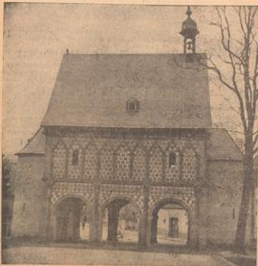
Die „Torhalle“ zu Lorsch