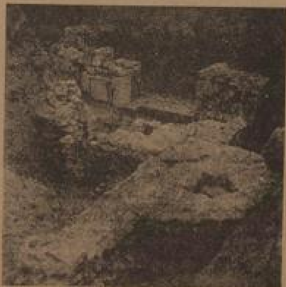
Blick auf den ausgegrabenen Torso des Osttores Man erkennt die Türschwelle und die Ansätze eines der Türpfeiler, die ehemals das Portal beschützten.

Diese Grabkapelle nach in ihrer Ausstattung außerordentlich schön und farbenprächtig gewesen