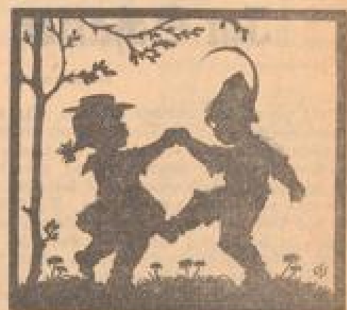
Kleines Tänzchen im Frühling