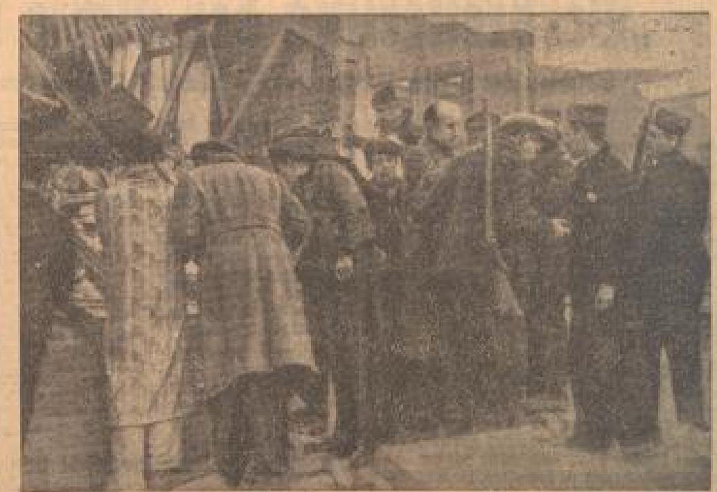
Nationalsozialistische Piloten bombardierten Barcelona. Ein Mannhandlager und viele von Millionen...